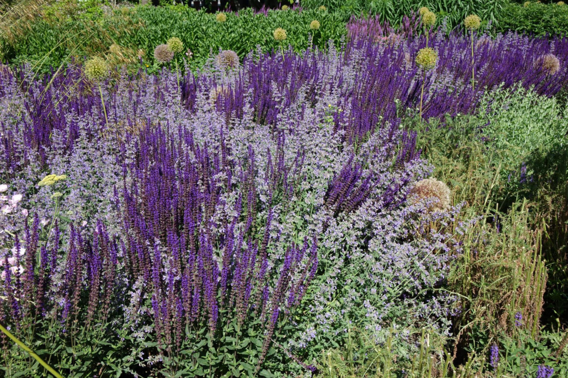
Juni [6] Salvia nemorosa + Nepeta x faassenii