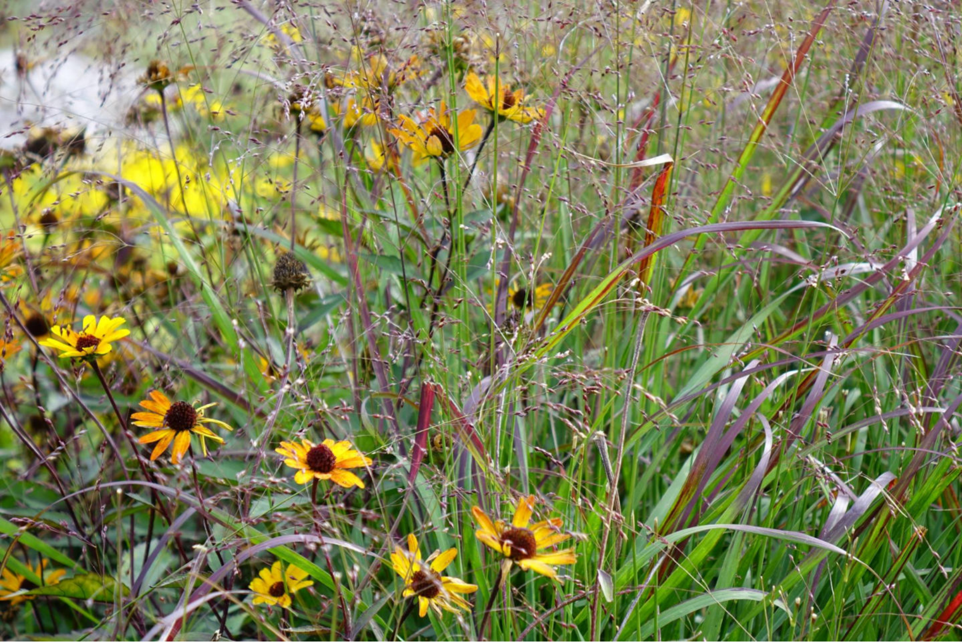
September [8] Helianthus 'Summer Nights' + Panicum 'Rehbraun' (?)