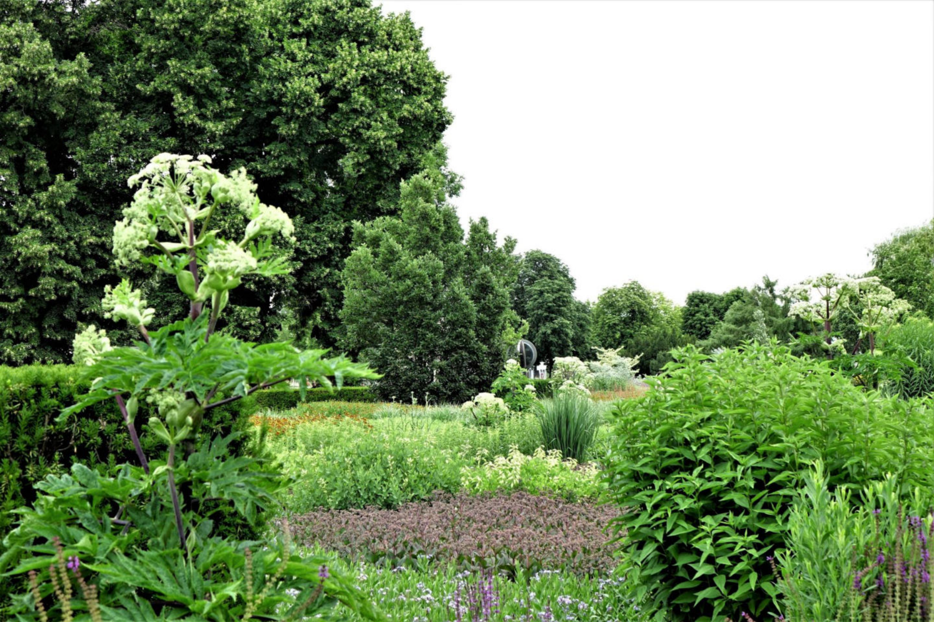
Juli [1] Angelica archangelica