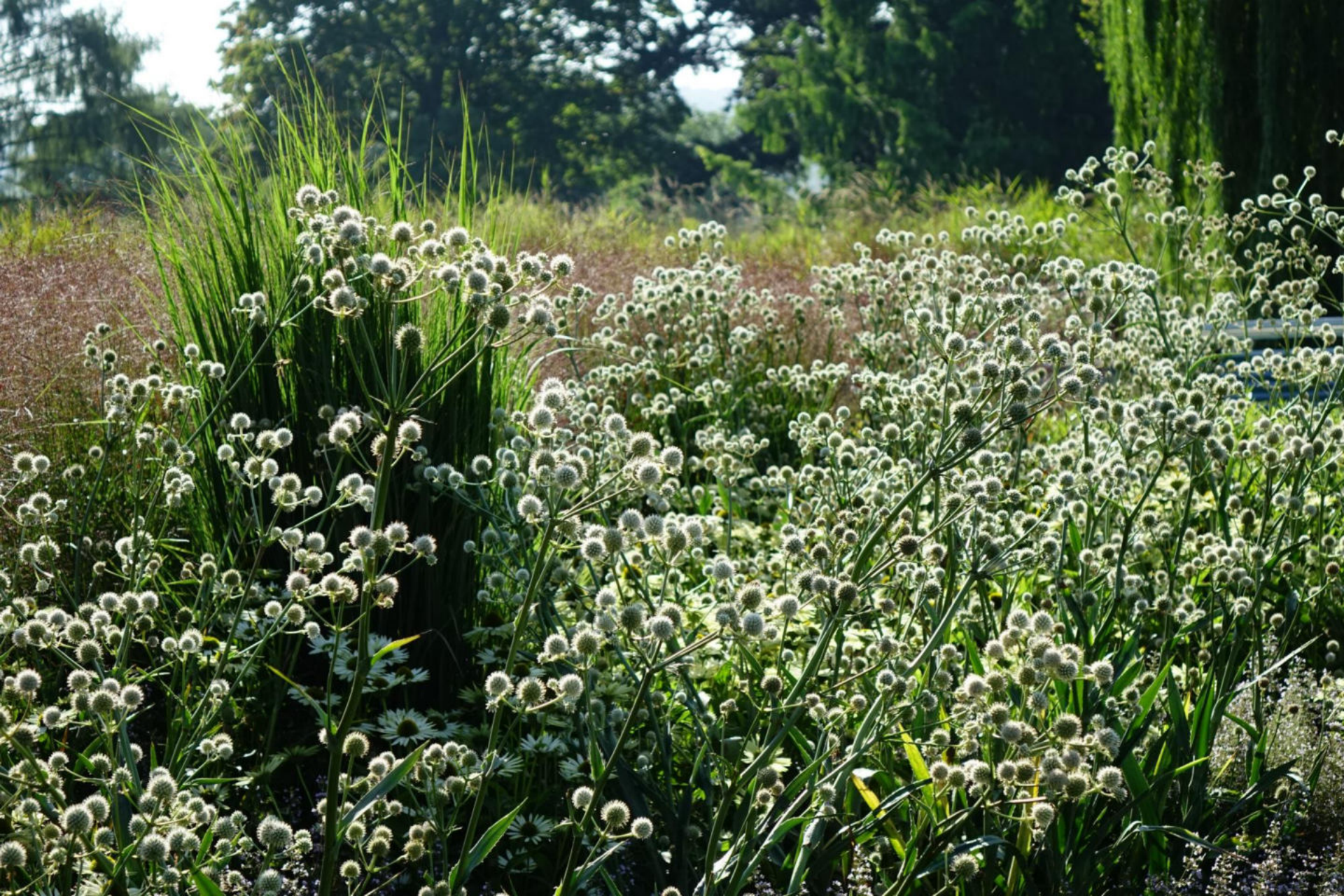
September [2] Eryngium yuccifolium