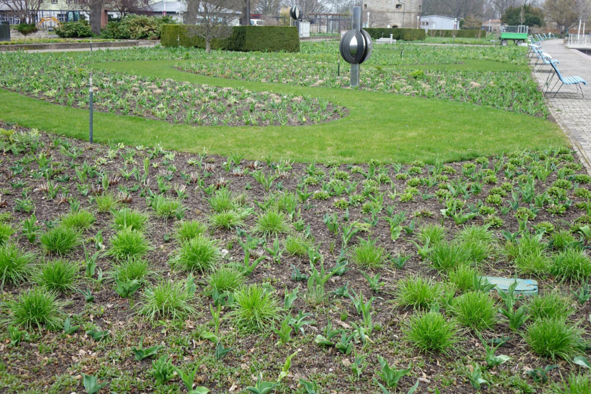
April [2] Die Rasenbänder haben wiederholt Wegeanschluss