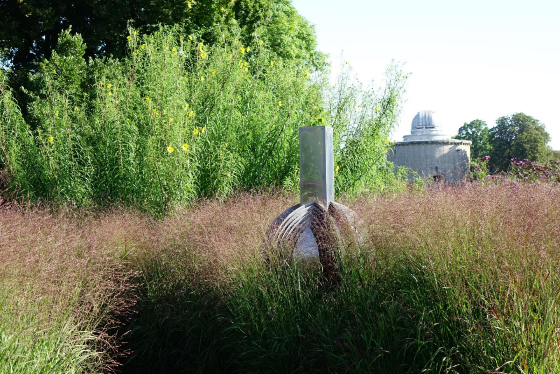
September [5] Helianthus orgyalis , Panicum virgatum