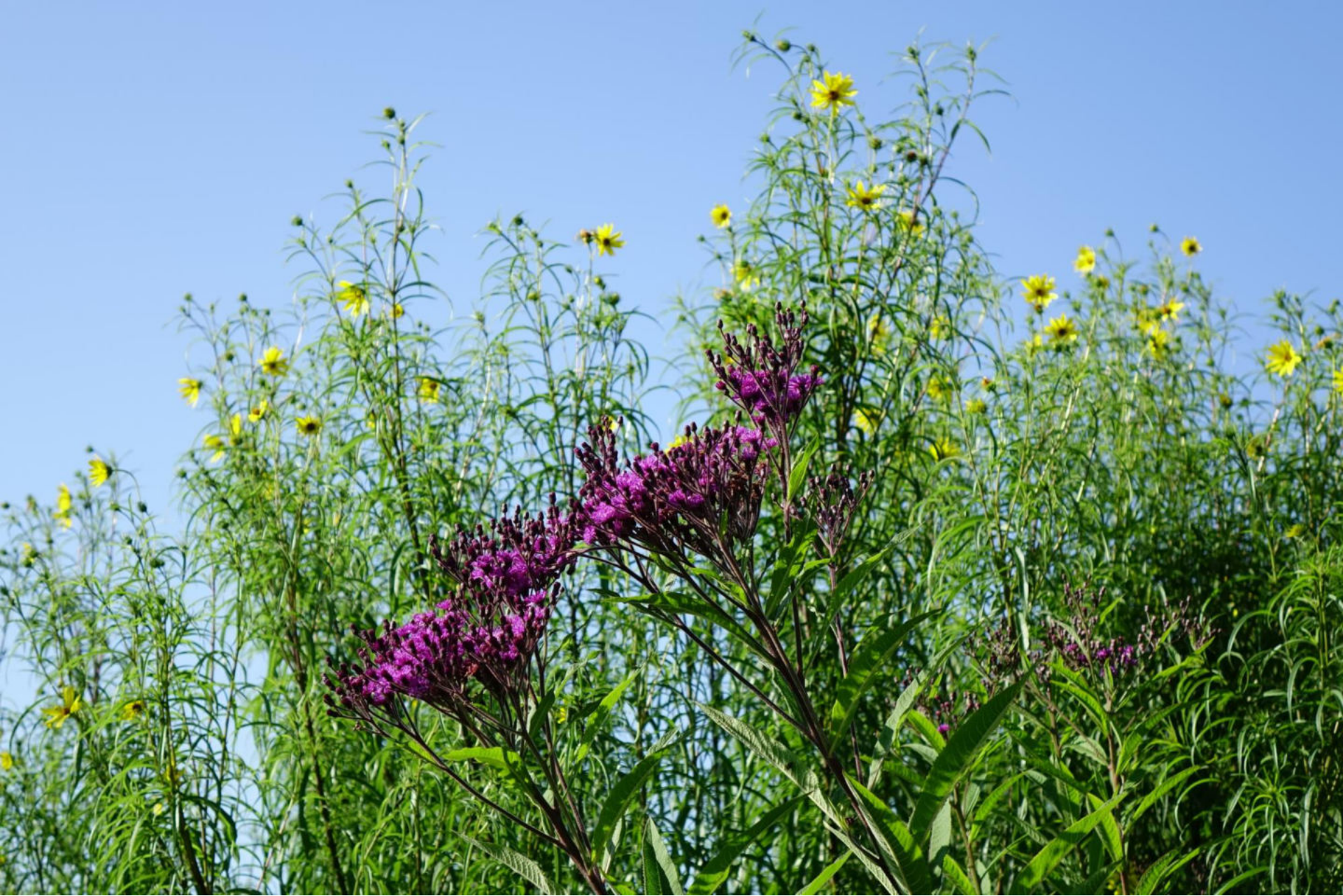
September [4] Helianthus orgyalis + Vernonia