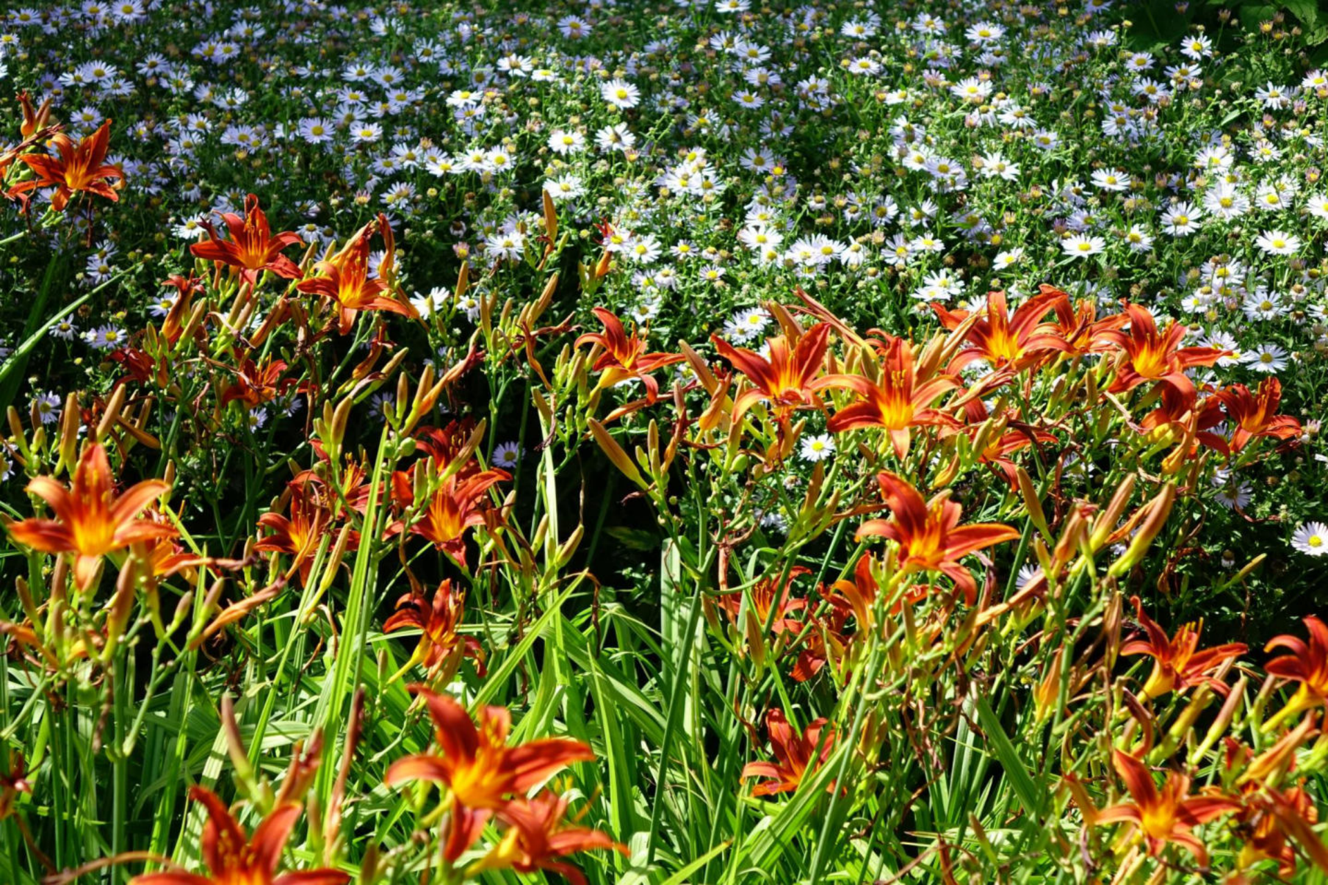
August [3] Kalimeris + Hemerocallis