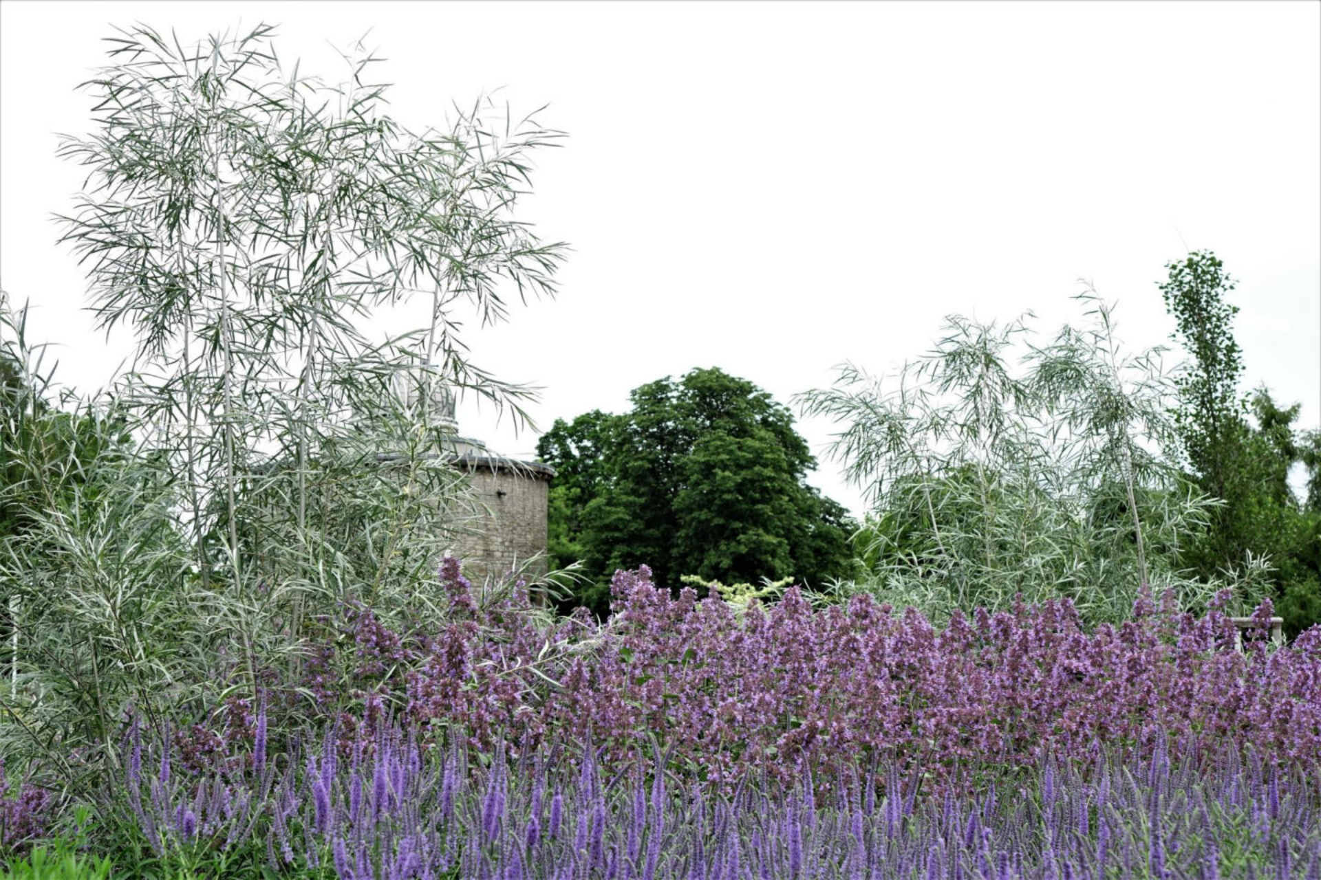
Juli [1] Salix exigua