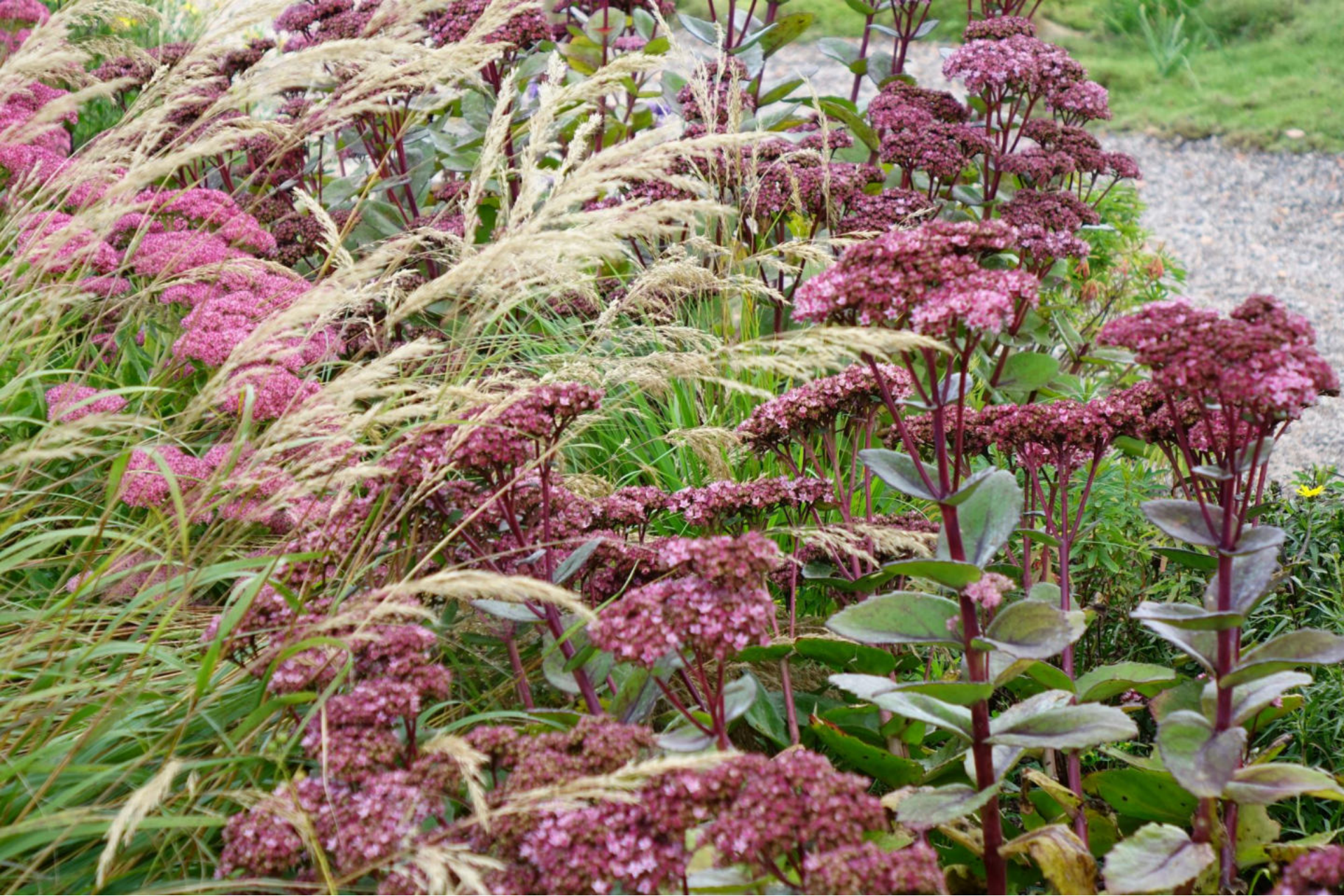
September [2] Stipa calamagrostis + Sedum 'Matrona'