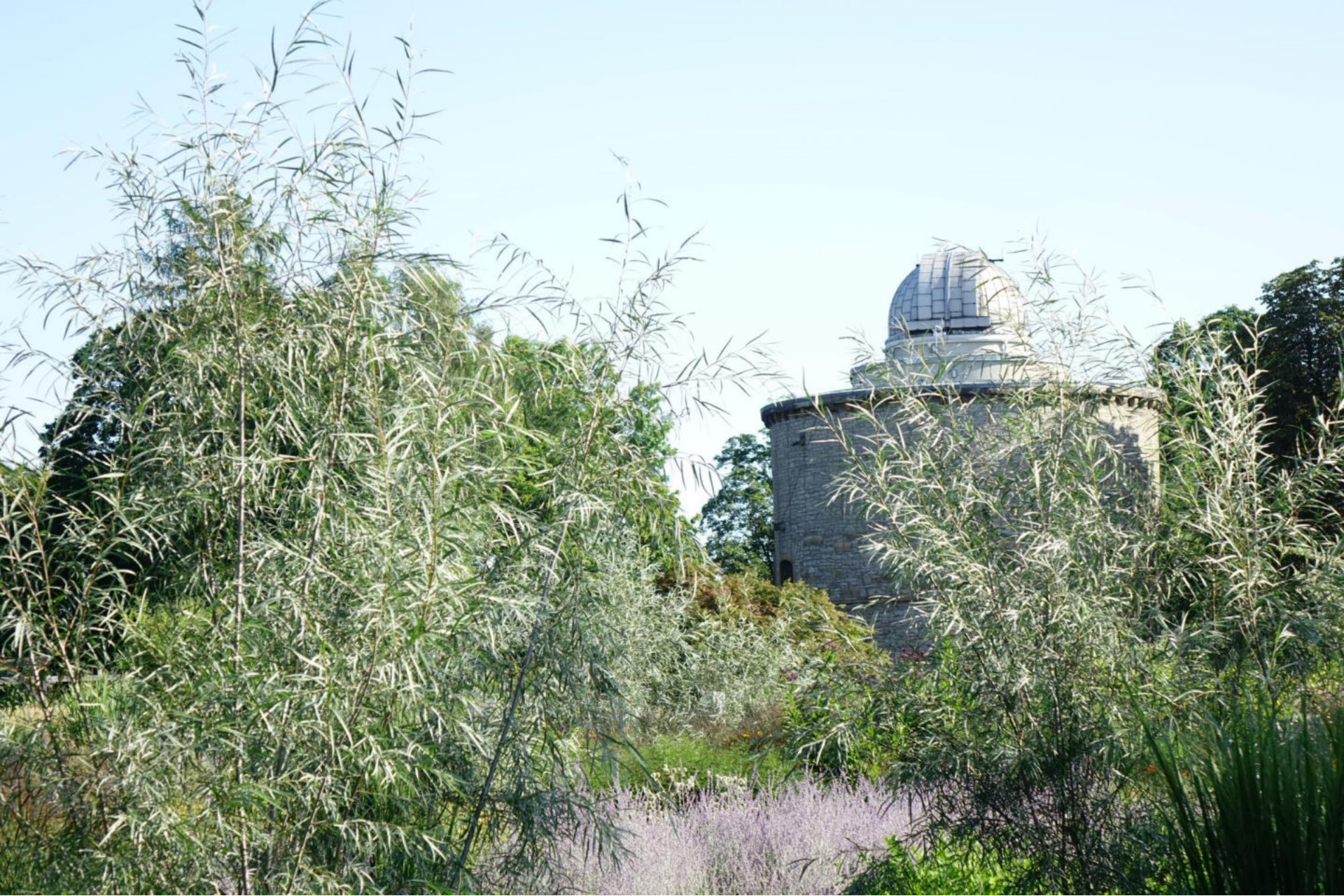
September [6] Salix exigua