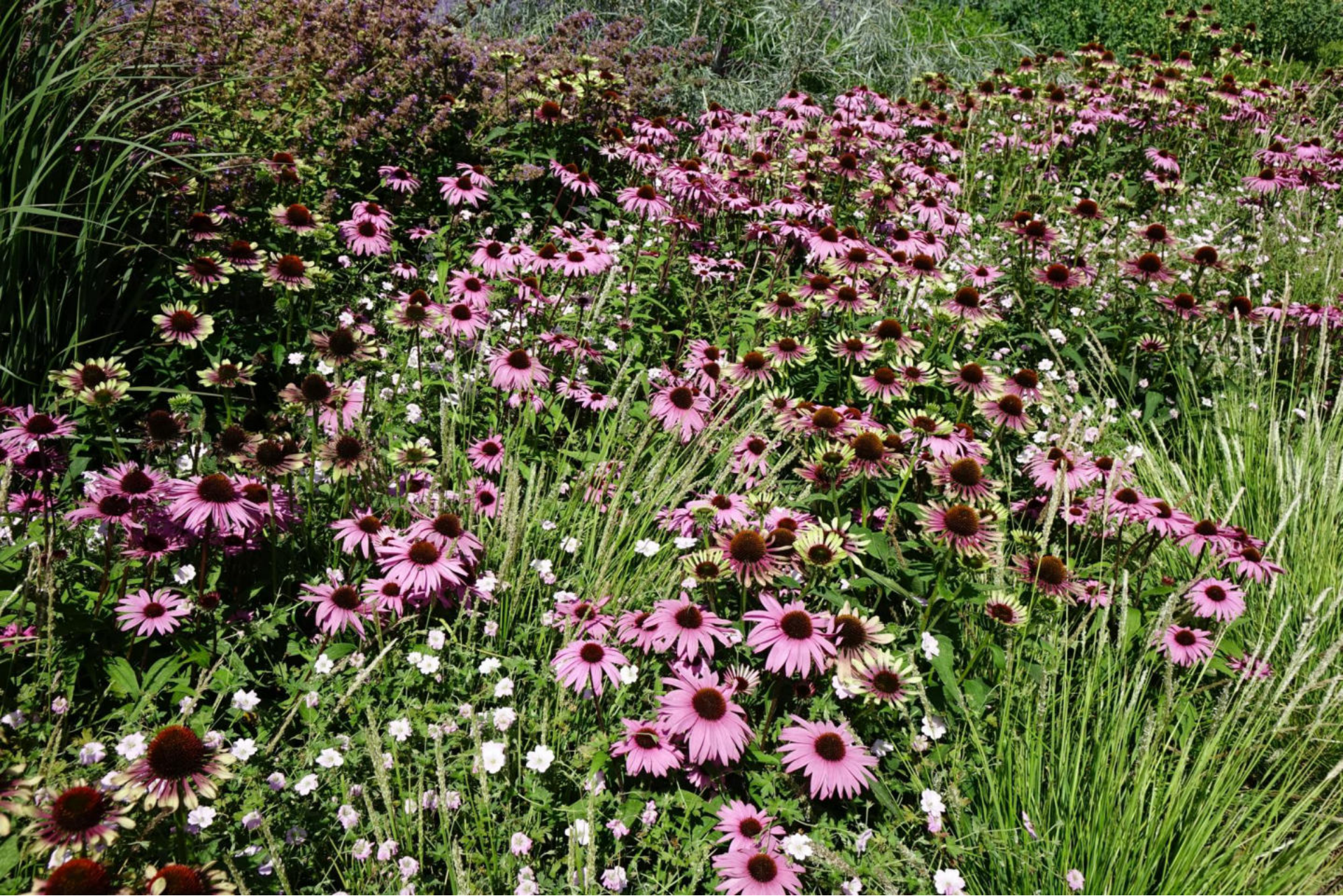
August [6] Echinacea purpurea + Sesleria autumnalis