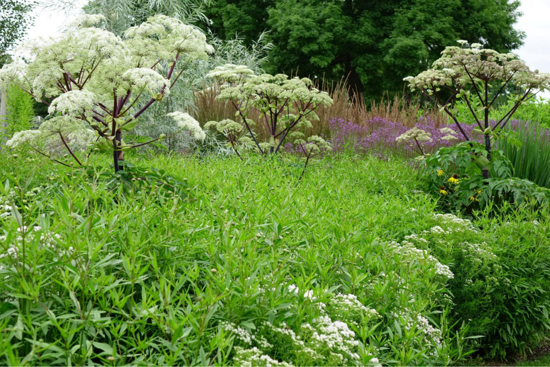
Juli [17] Angelica archangelica