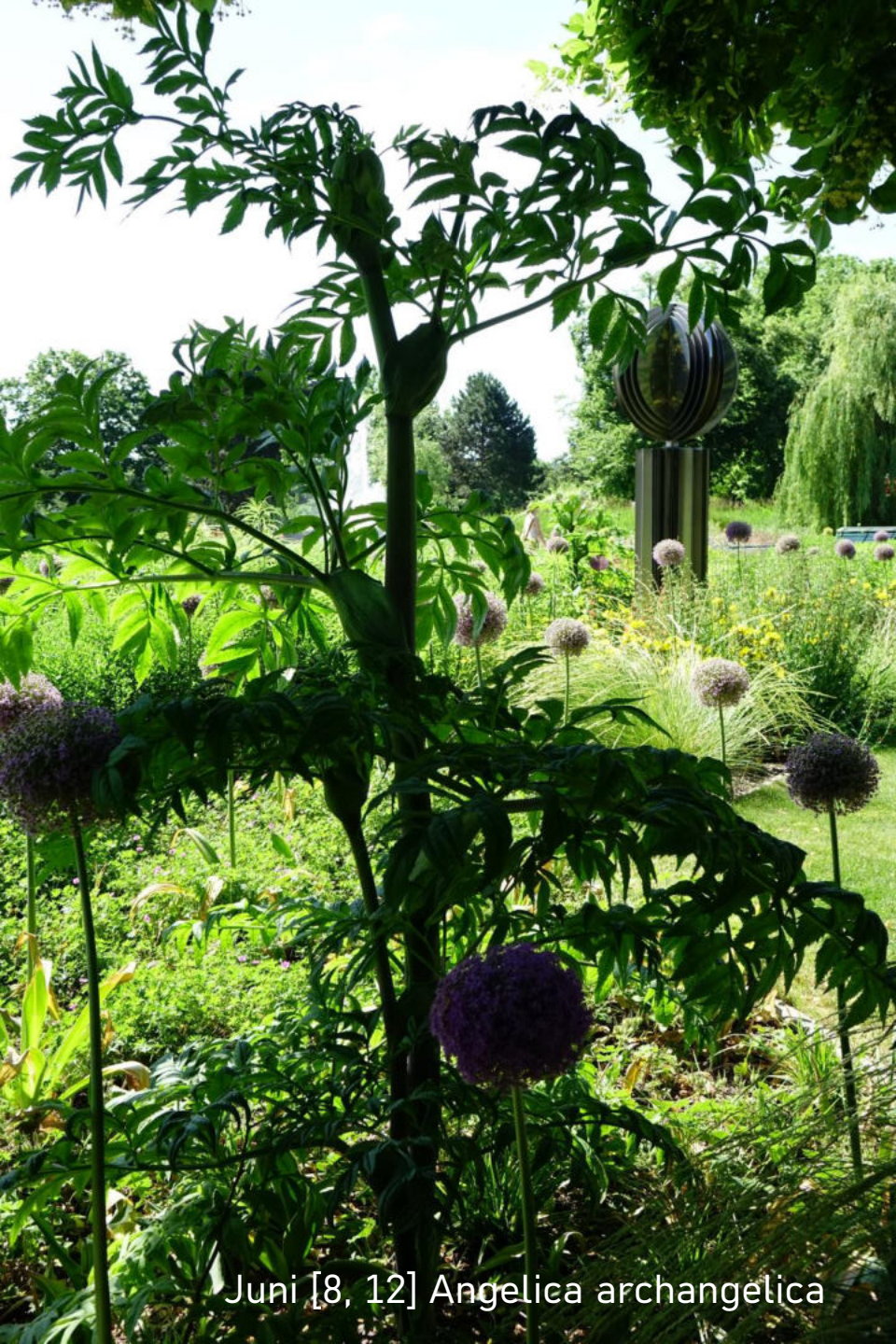
Juni [8, 12] Angelica archangelica