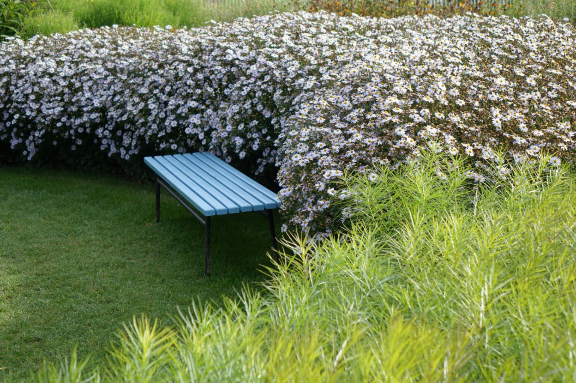
September [7] Kalimeris