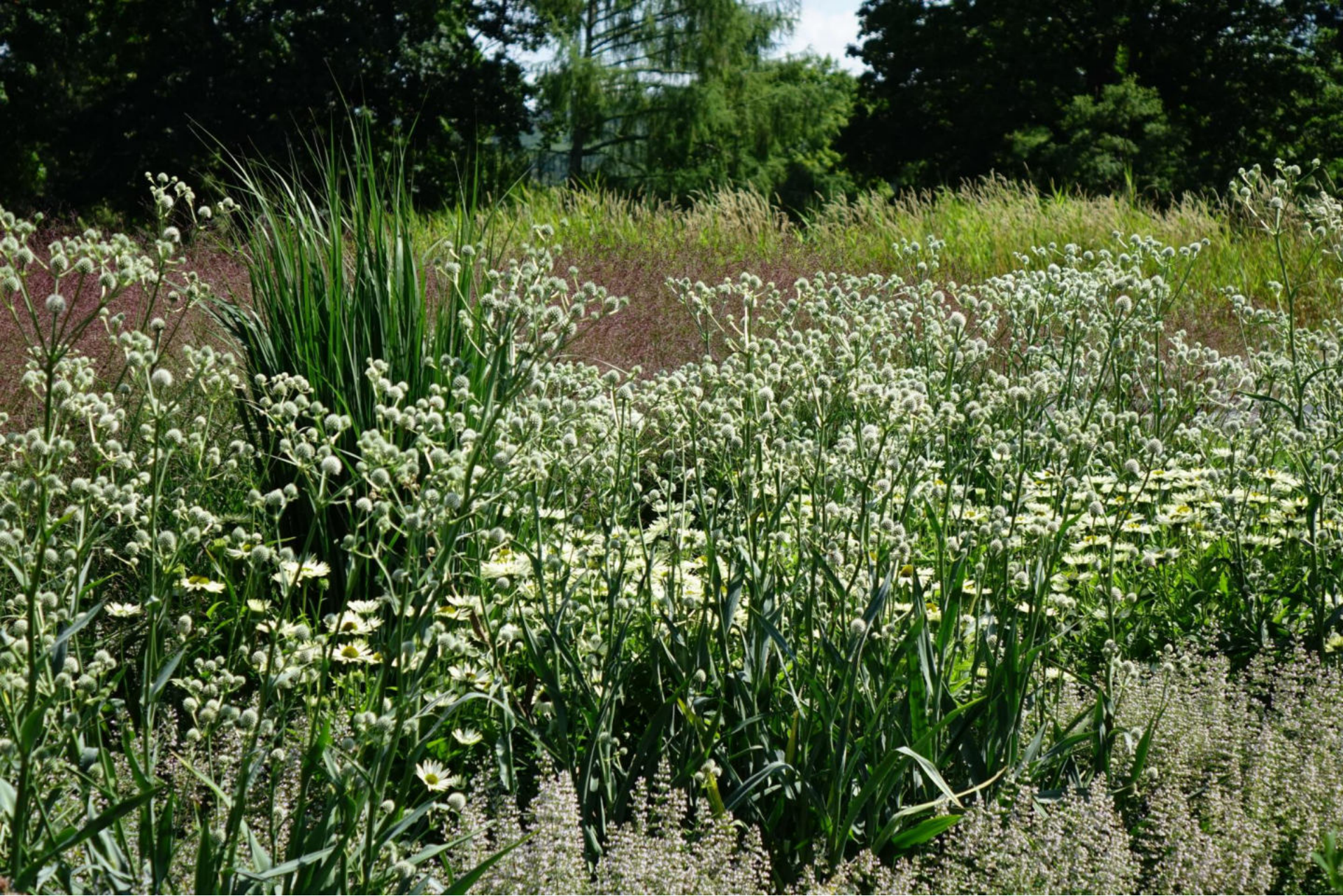
August [4] Eryngium yuccifolium