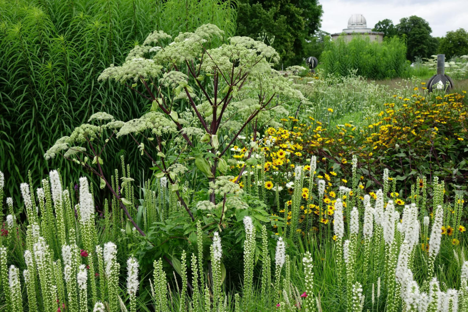
Juli [3] Angelica archangelica + Heliopsis 'Summer Nights' + Liatris