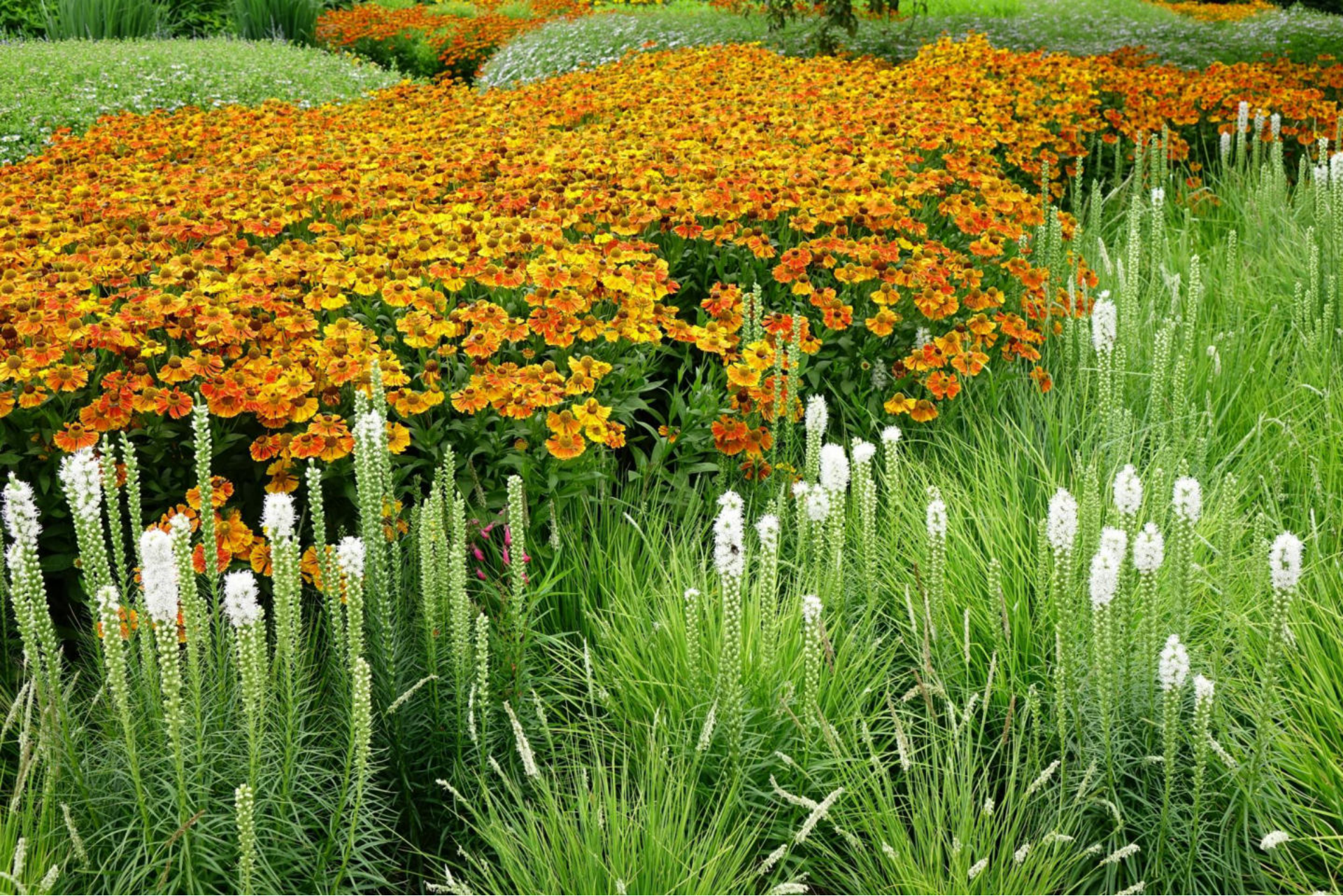
Juli [7] Helenium + Liatris