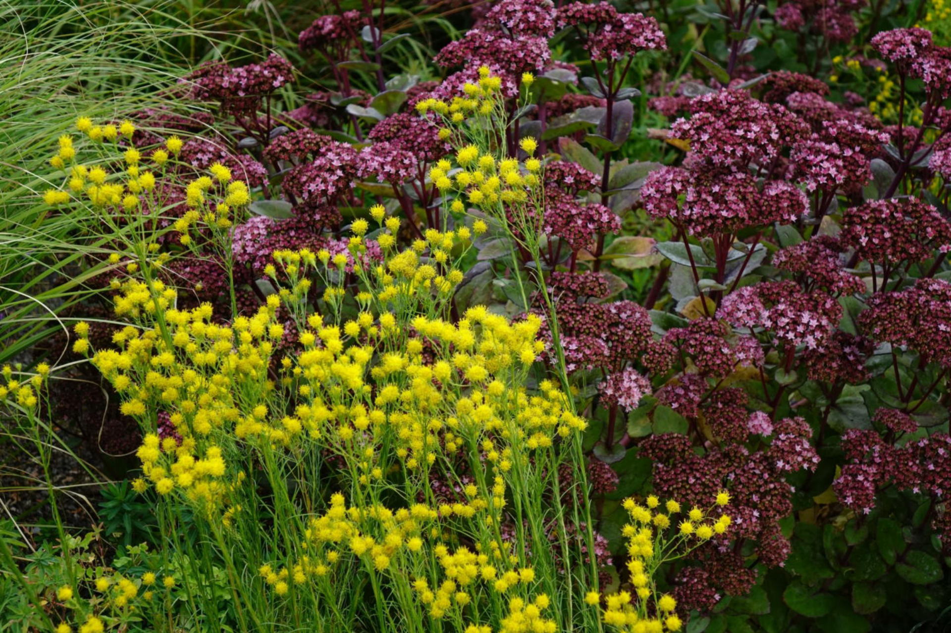
September [1] Aster linosyris + Sedum 'Matrona'