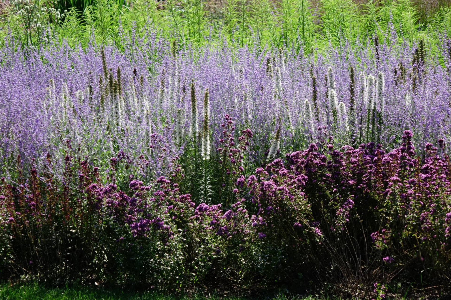
August [12] Origanum + Liatris + Perovskia