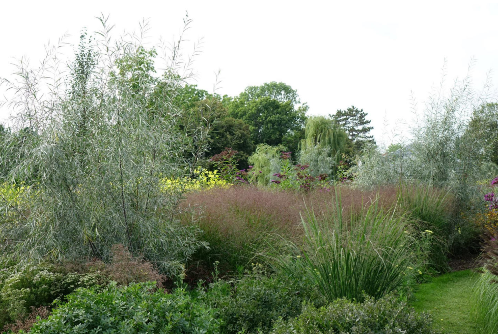
September [4] Salix exigua