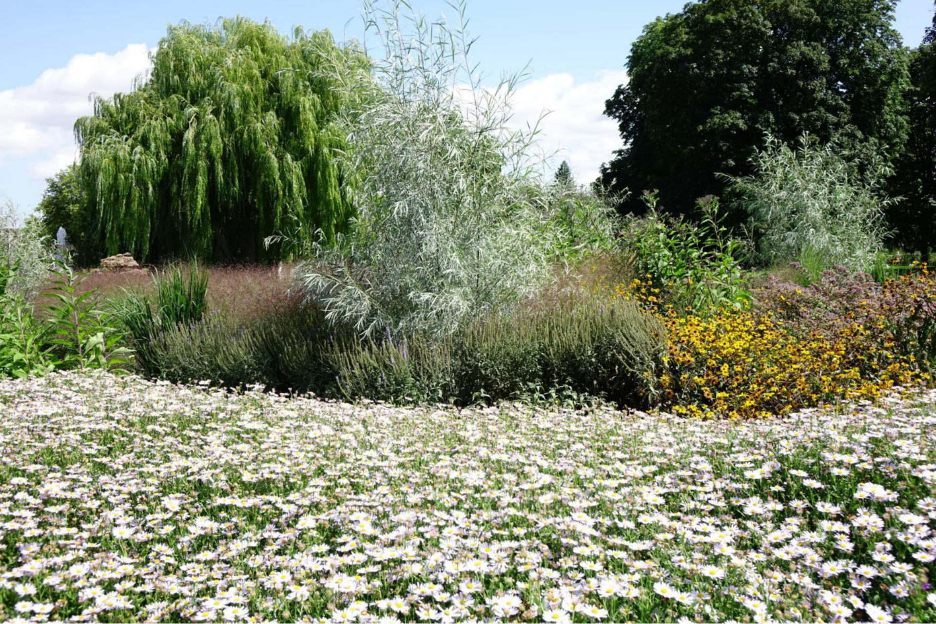
August [3] Kalimeris, Salix exigua