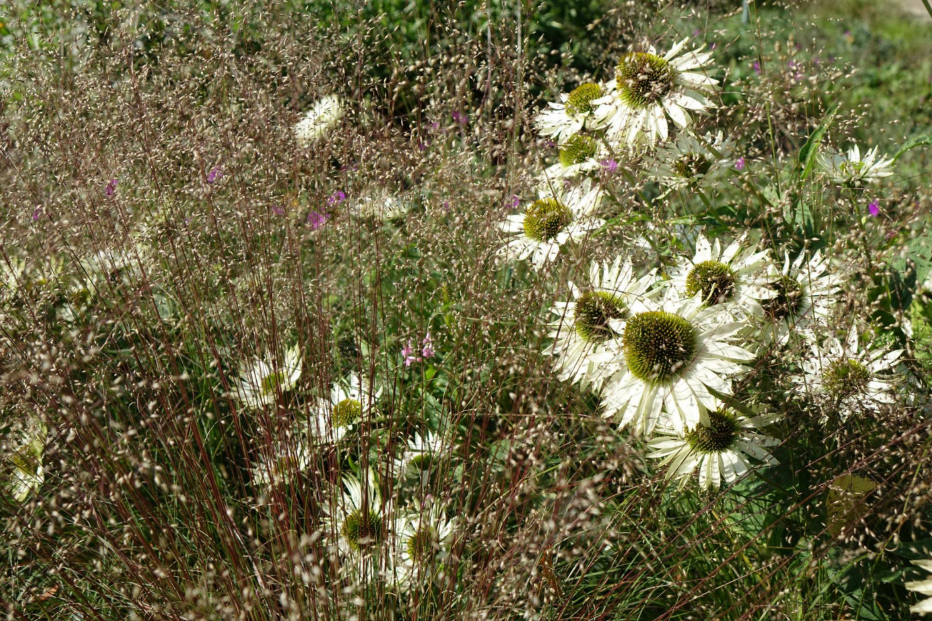
August [14] Echinacea purpurea + Sporobolus