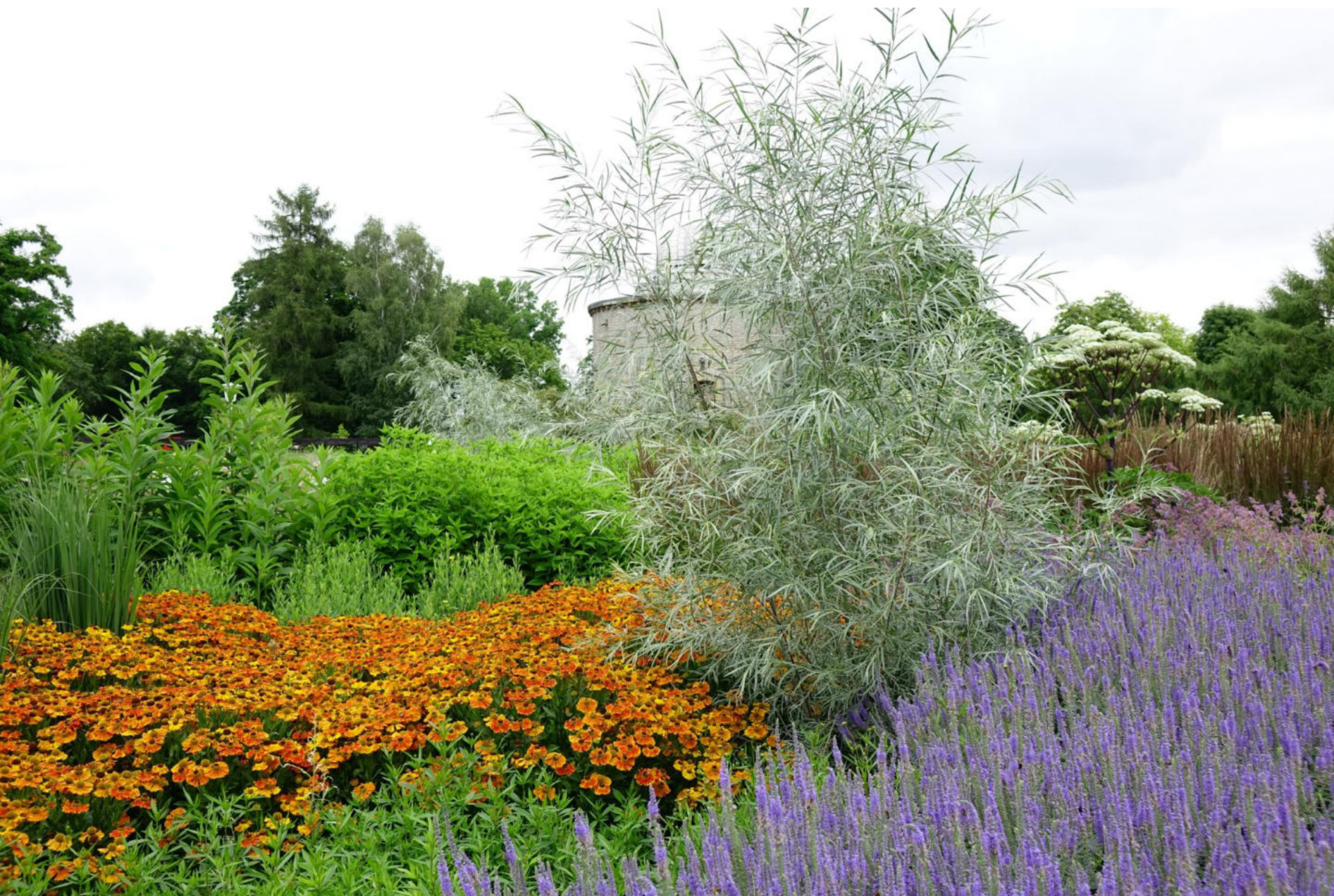
Juli [14] Braun (=trübes Orange) + Blau, gesteigert durch Silbergrau