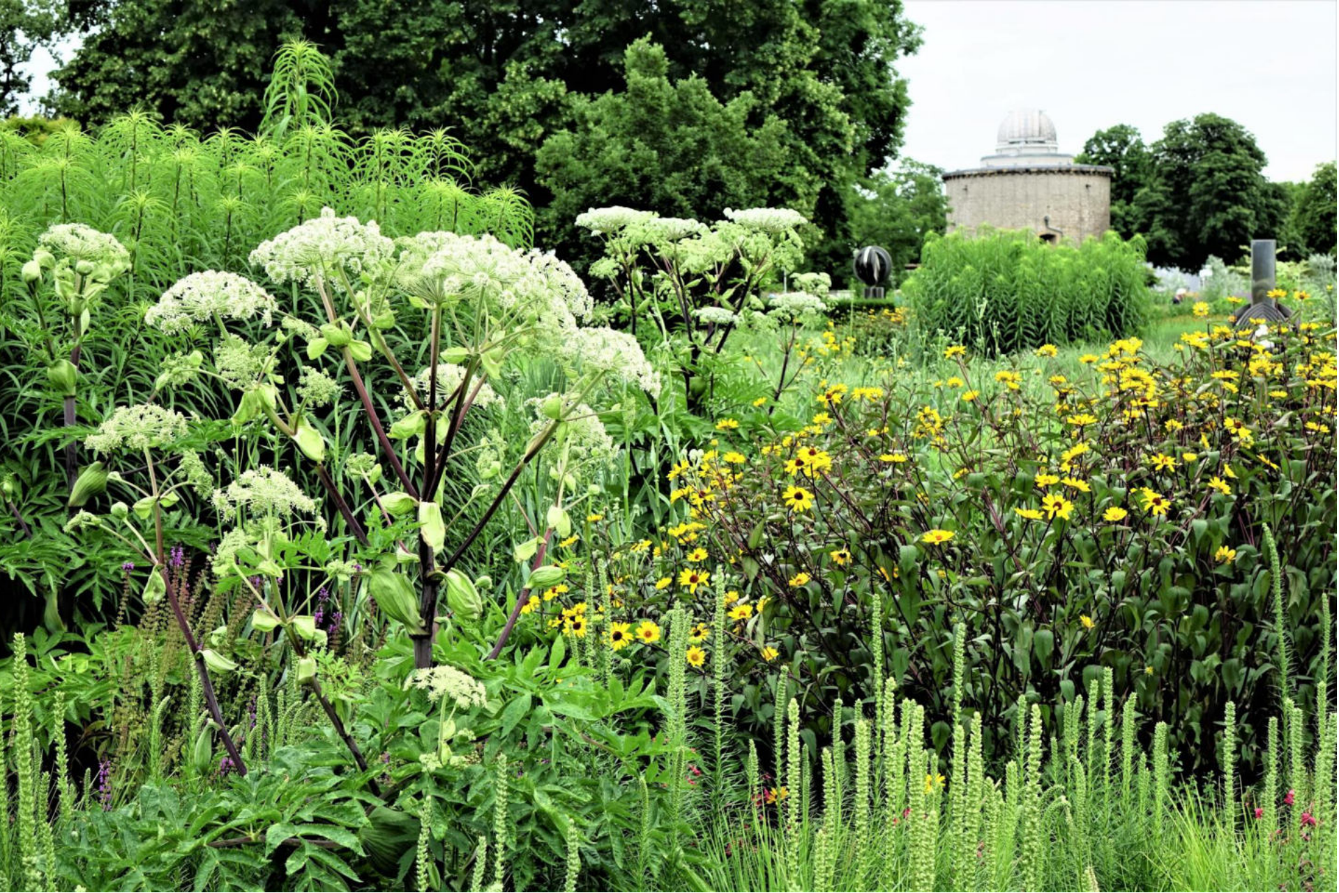
Juli [2] Angelica archangelica + Heliopsis 'Summer Nights'