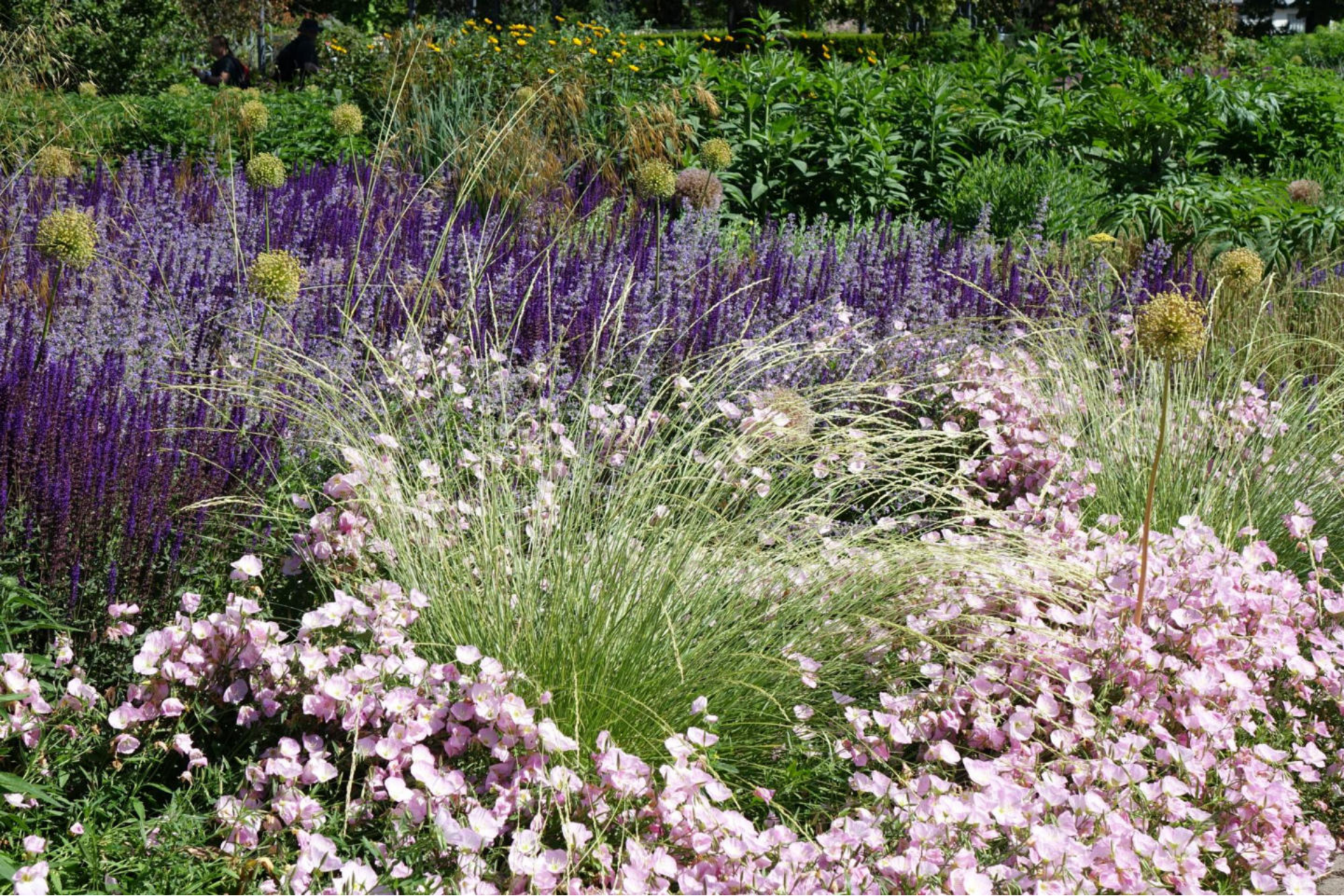
Juni [4] Festuca mairei