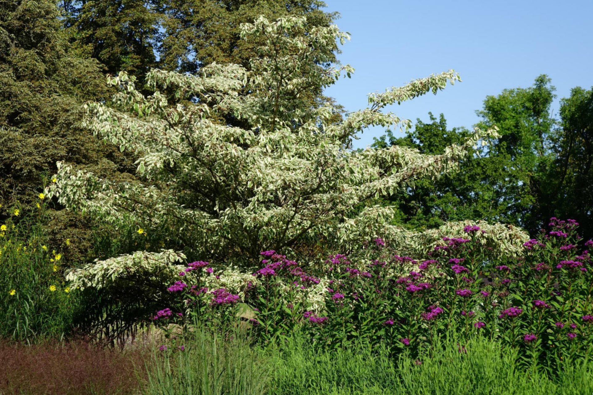
August [13] Cornus controversa 'Variegata' + Vernonia