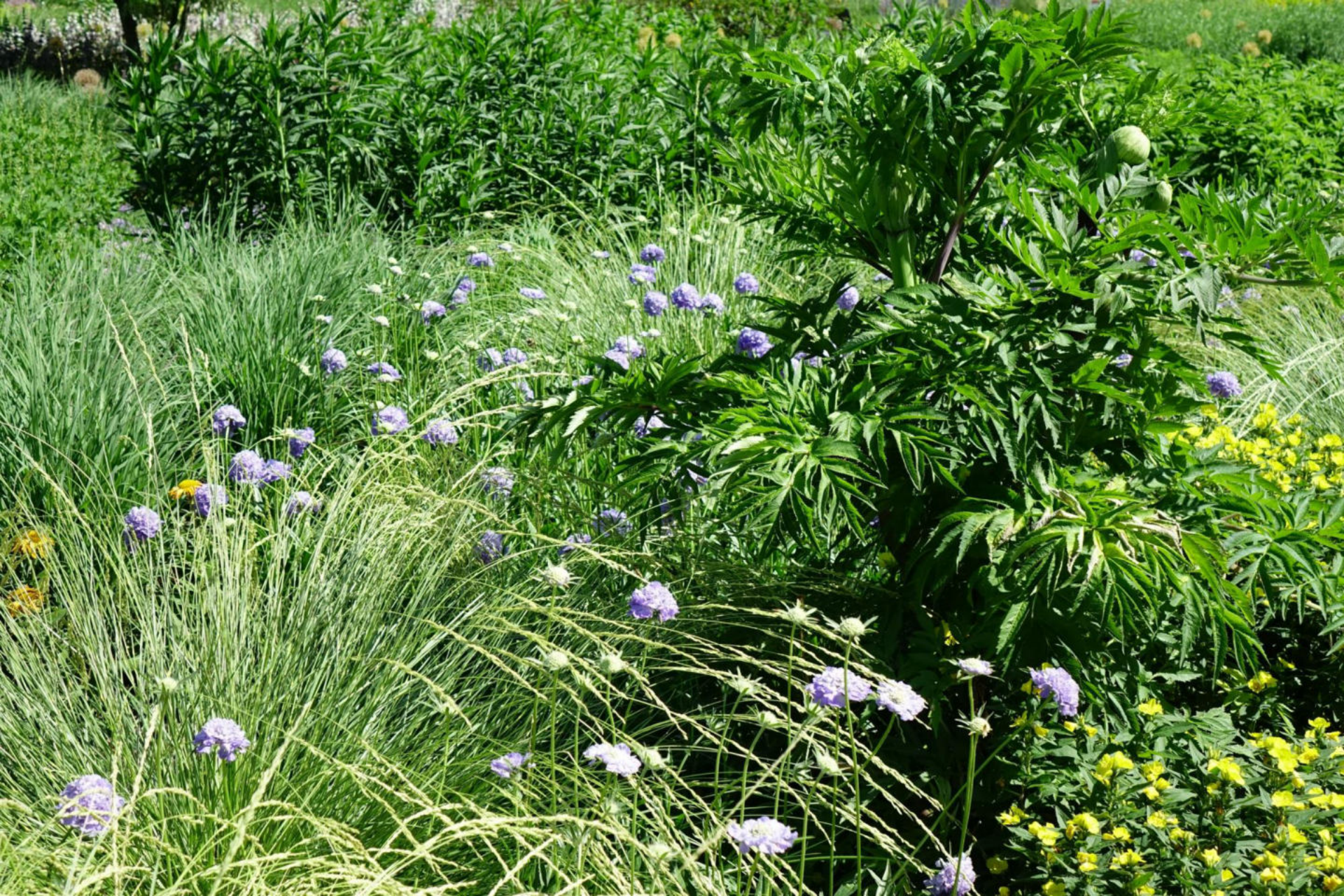
Juni [9] Scabiosa 'Butterfly Blue' + Festuca mairei