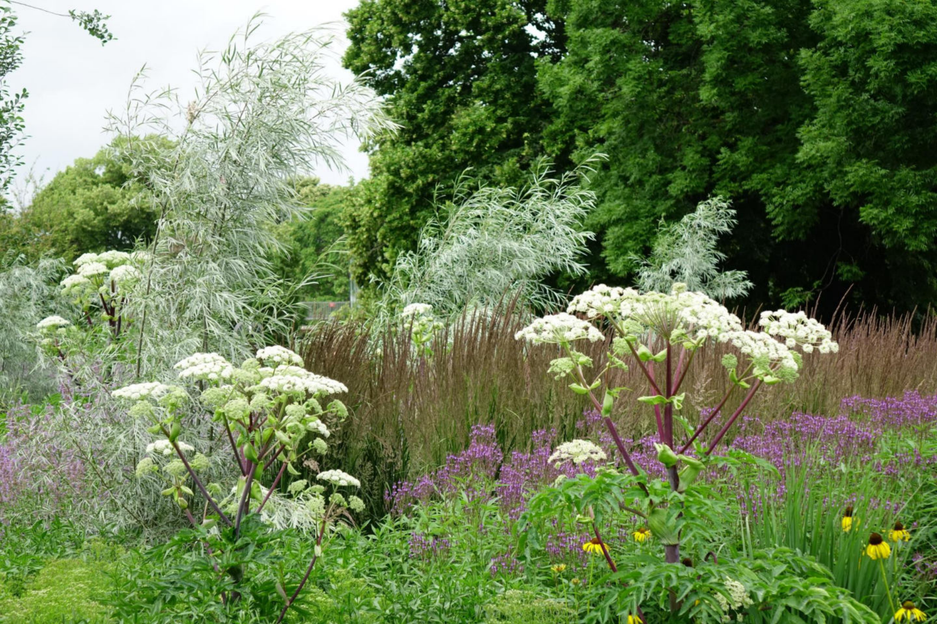
Juli [3] Salix exigua + Angelica archangelica