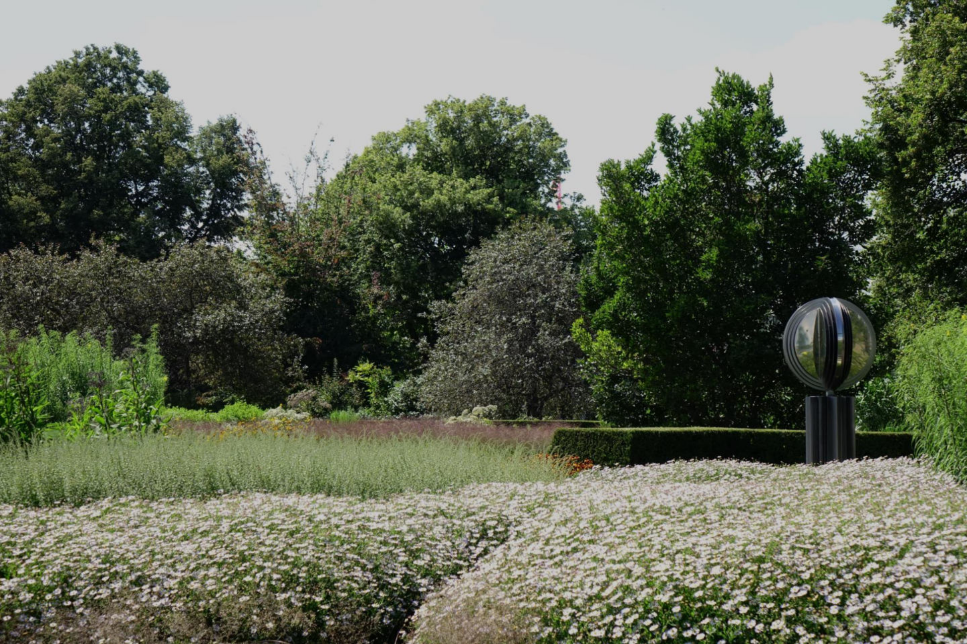
August [2] Kalimeris + Panicum virgatum