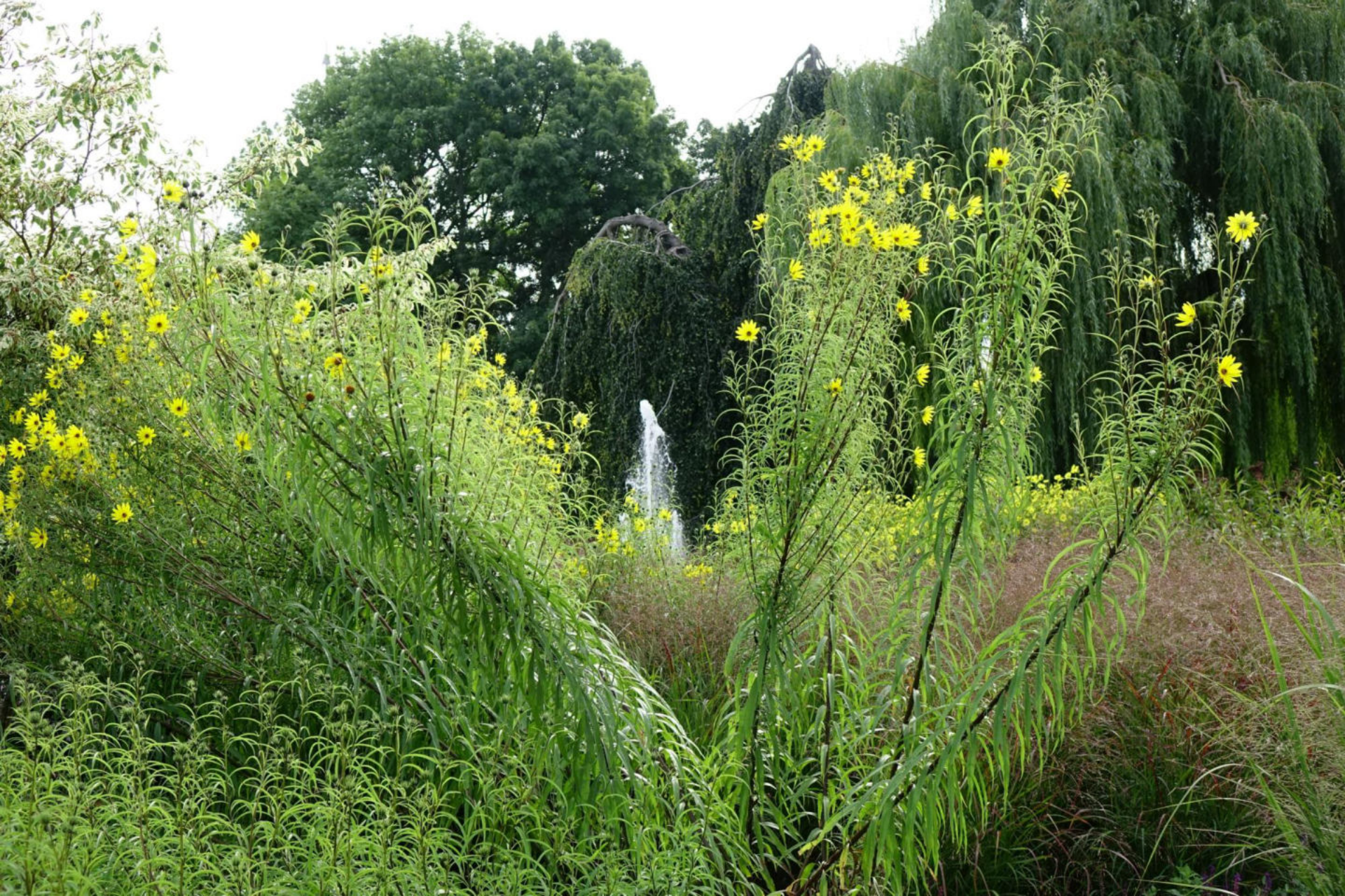
September [11] Helianthus orgyalis