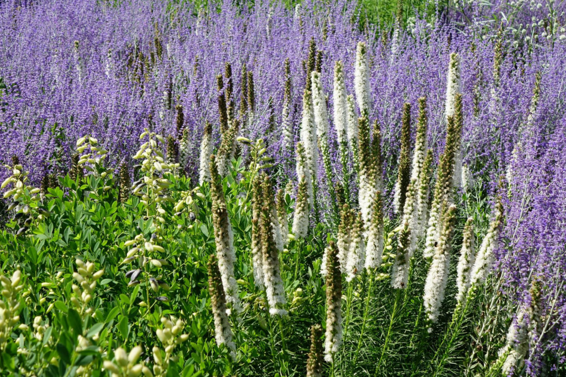
August [7] Perovskia + Baptisia + Liatris