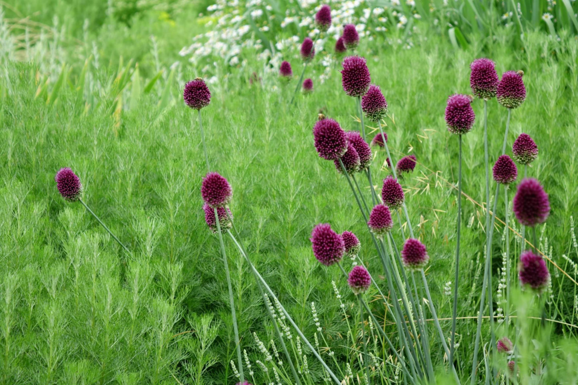
Juli [4] Allium sphaerocephalon