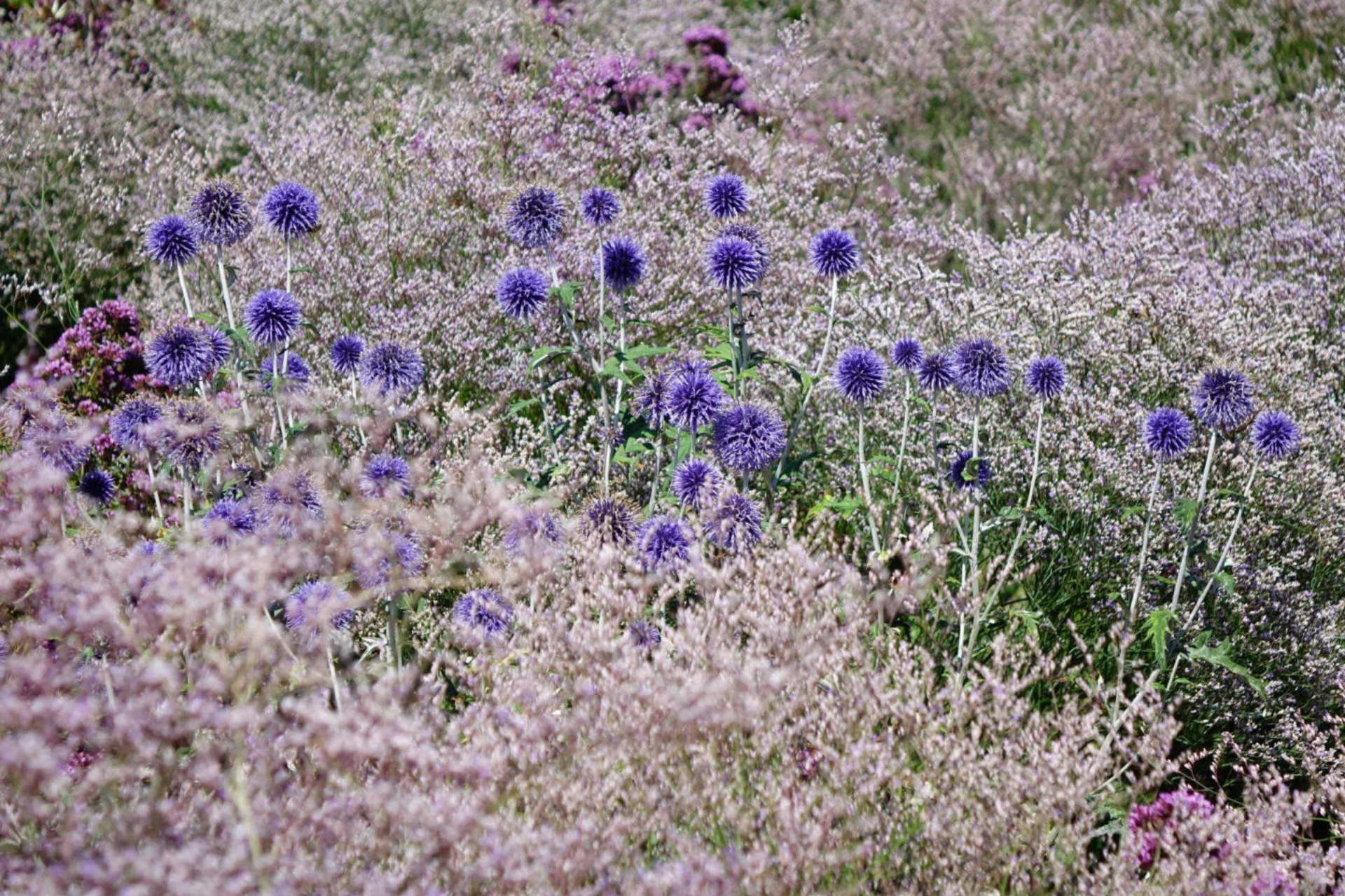
August [10] Echinops