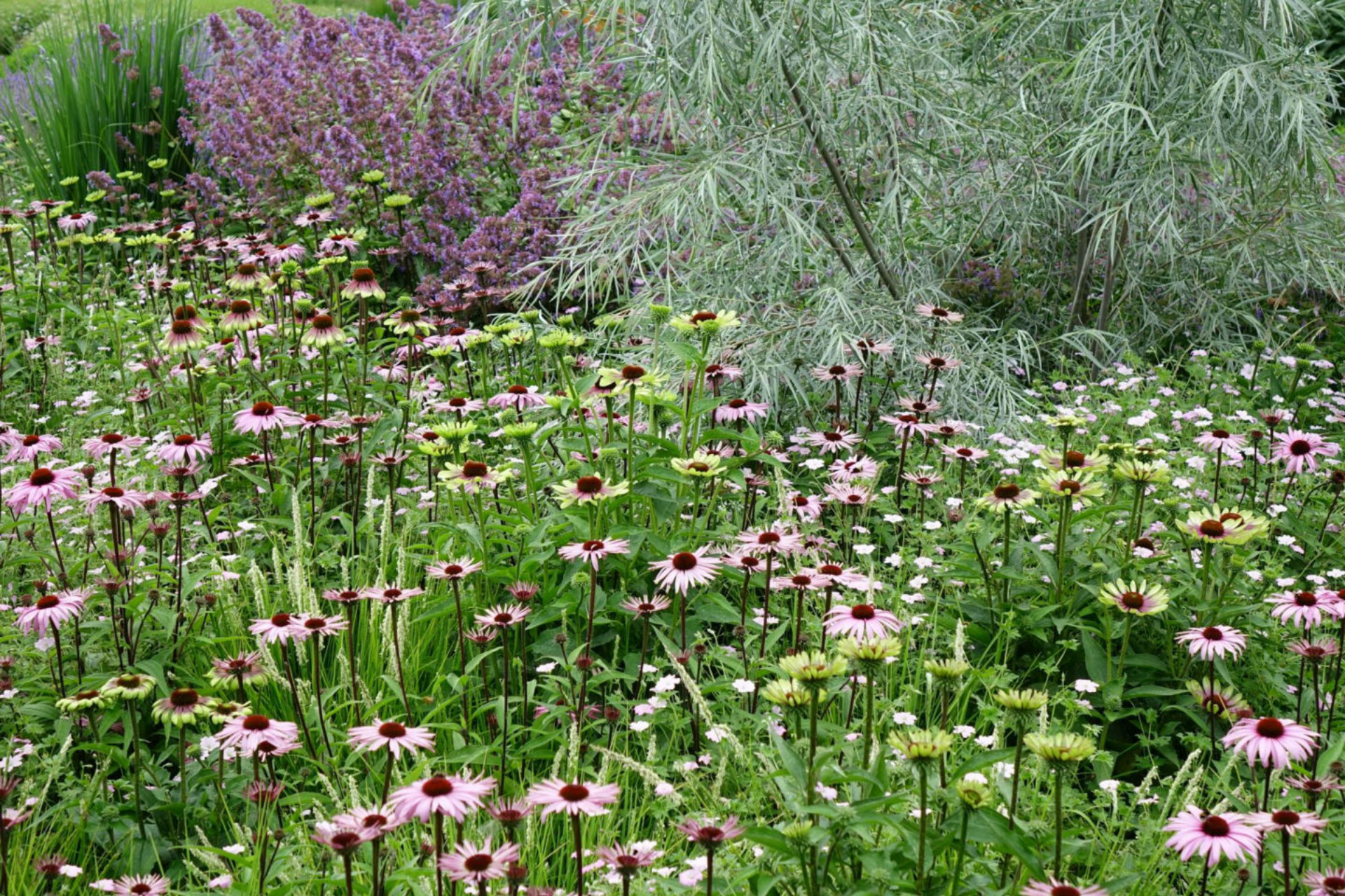
Juli [11] Echinacea purpurea + Salix exigua