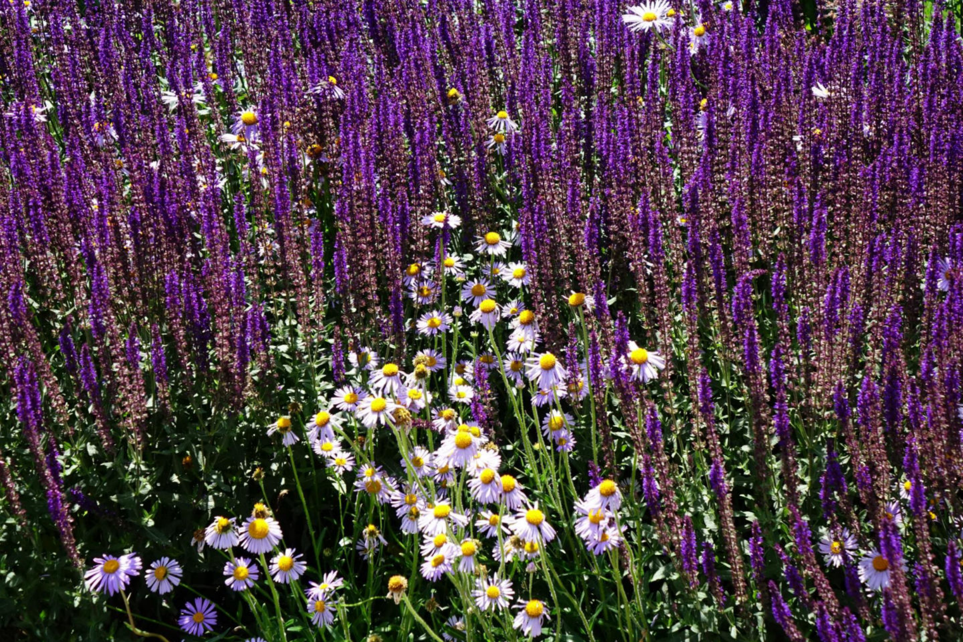
Juni [10] Salvia nemorosa