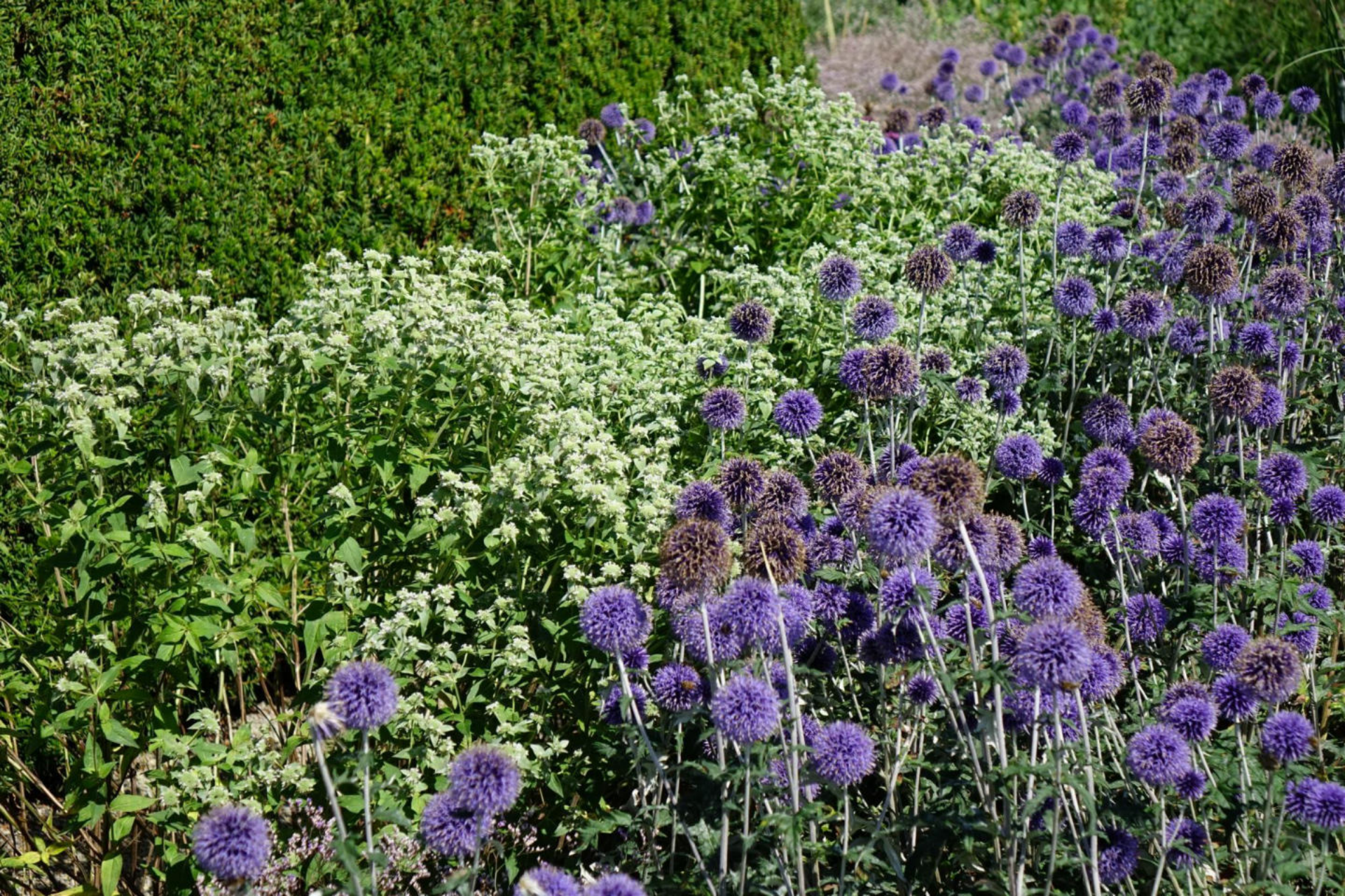
August [9] Echinops + Pycnanthemum