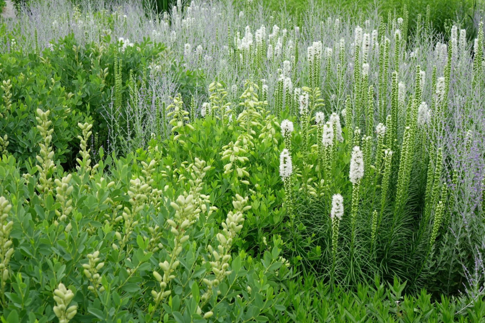
Juli [12] Baptisia + Liatris + Perovskia