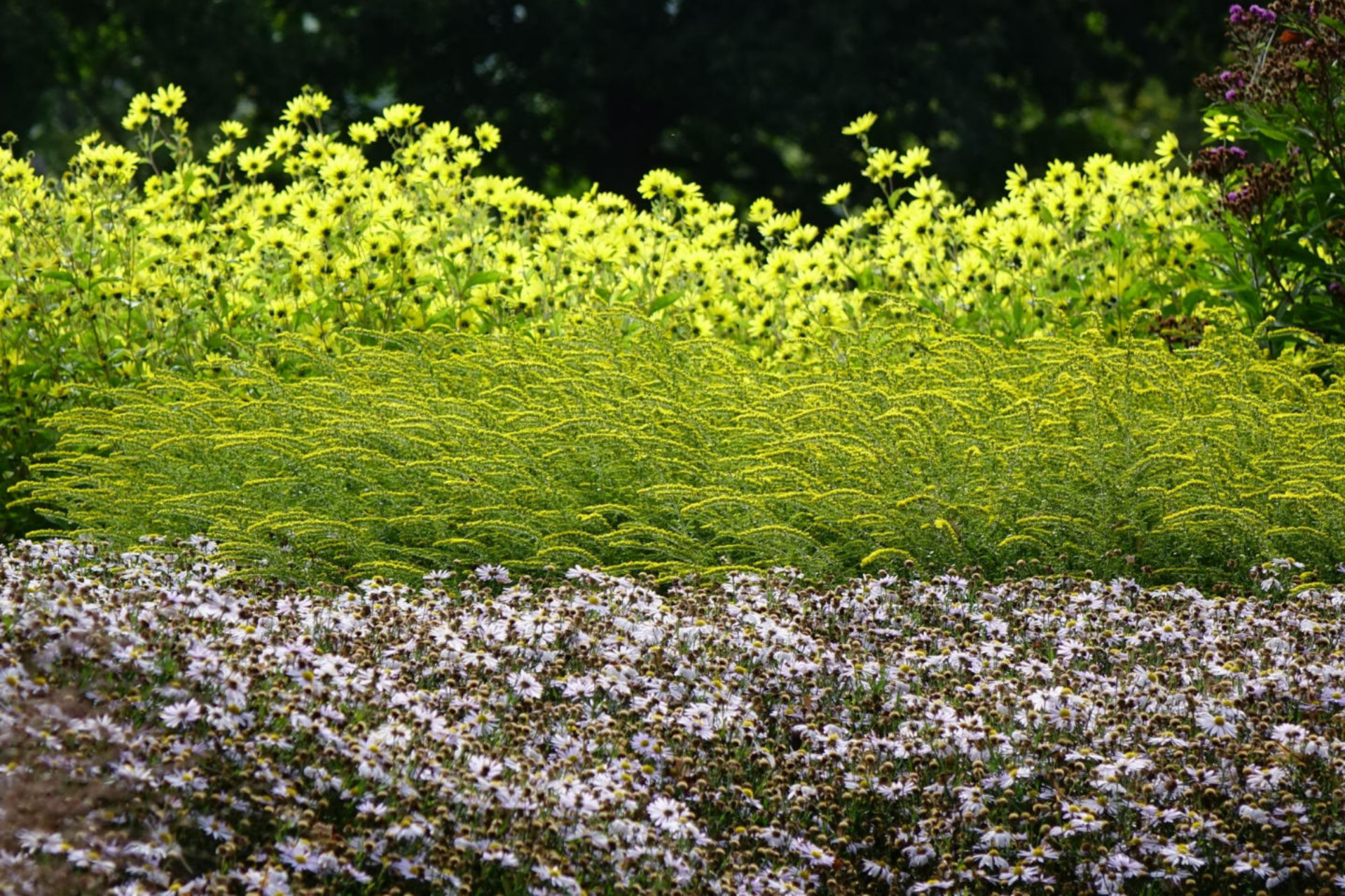
September [10] Kalimeris, Solidago caesia , Helianthus 'Lemon Queen'