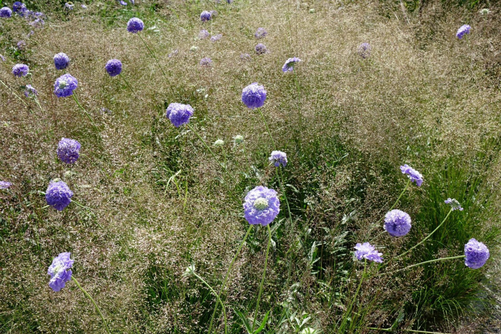
August [11] Scabiosa 'Butterfly Blue' + Sporobolus