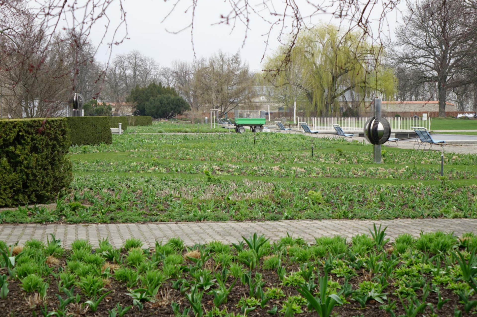
April [8] Die in die Pflanzung ragenden Eibenriegel gliedern disziplinierend und bieten Bänken Rückendeckung