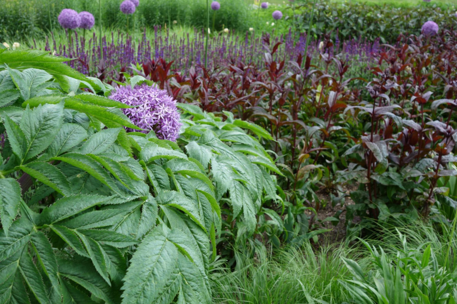
Juni [3] Penstemon 'Huskers Red'