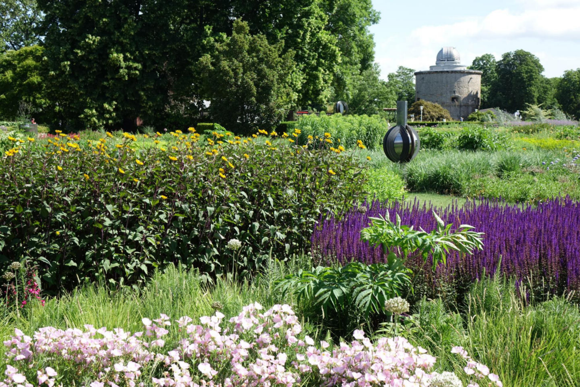
Juni [2] Heliopsis 'Summer Nights'