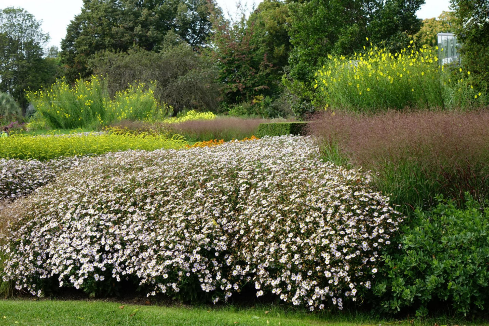
September [9] Kalimeris, Panicum virgatum, Helianthus orgyalis