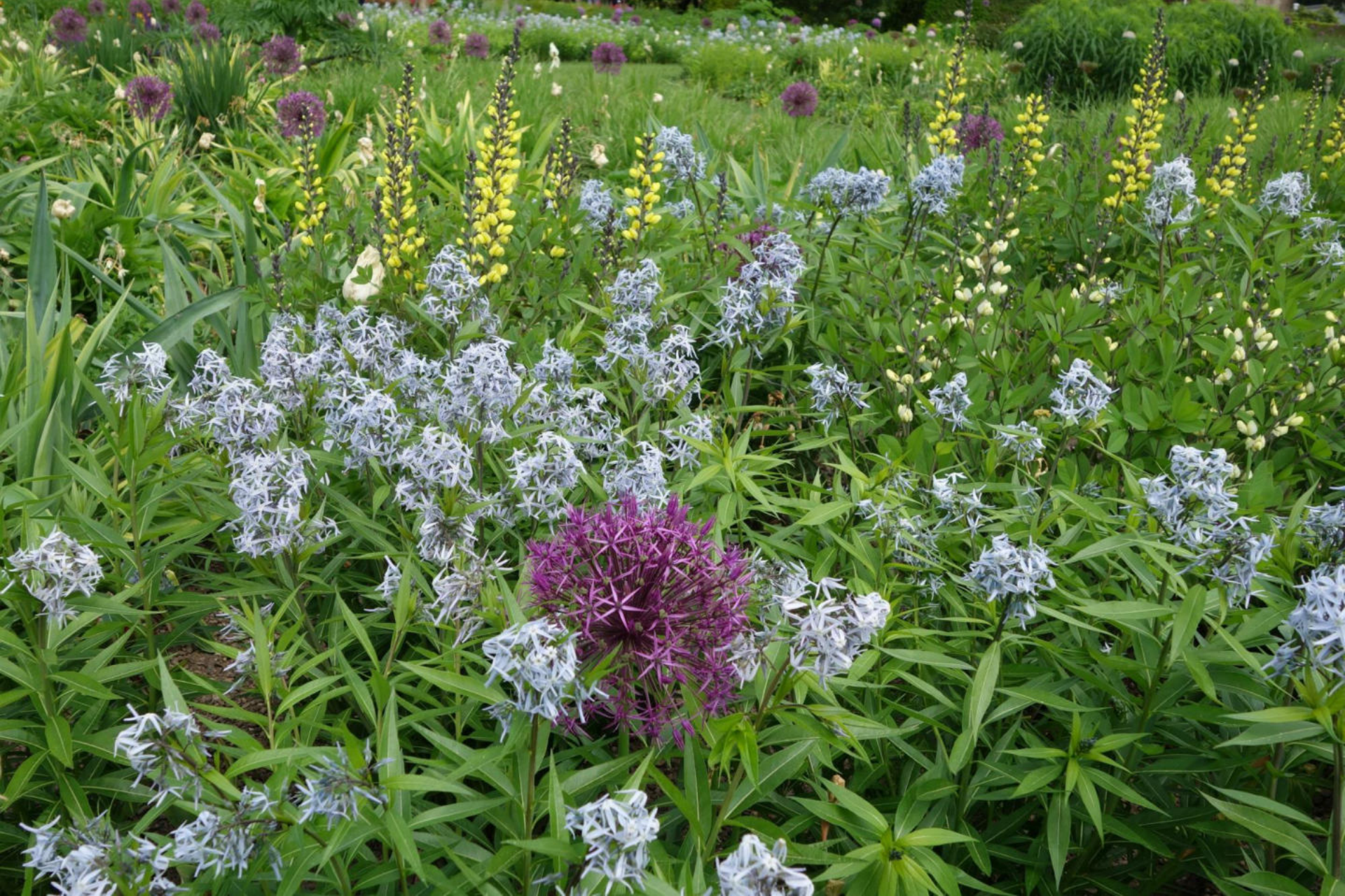
Juni [1] Allium christophii , Amsonia , Thermopsis