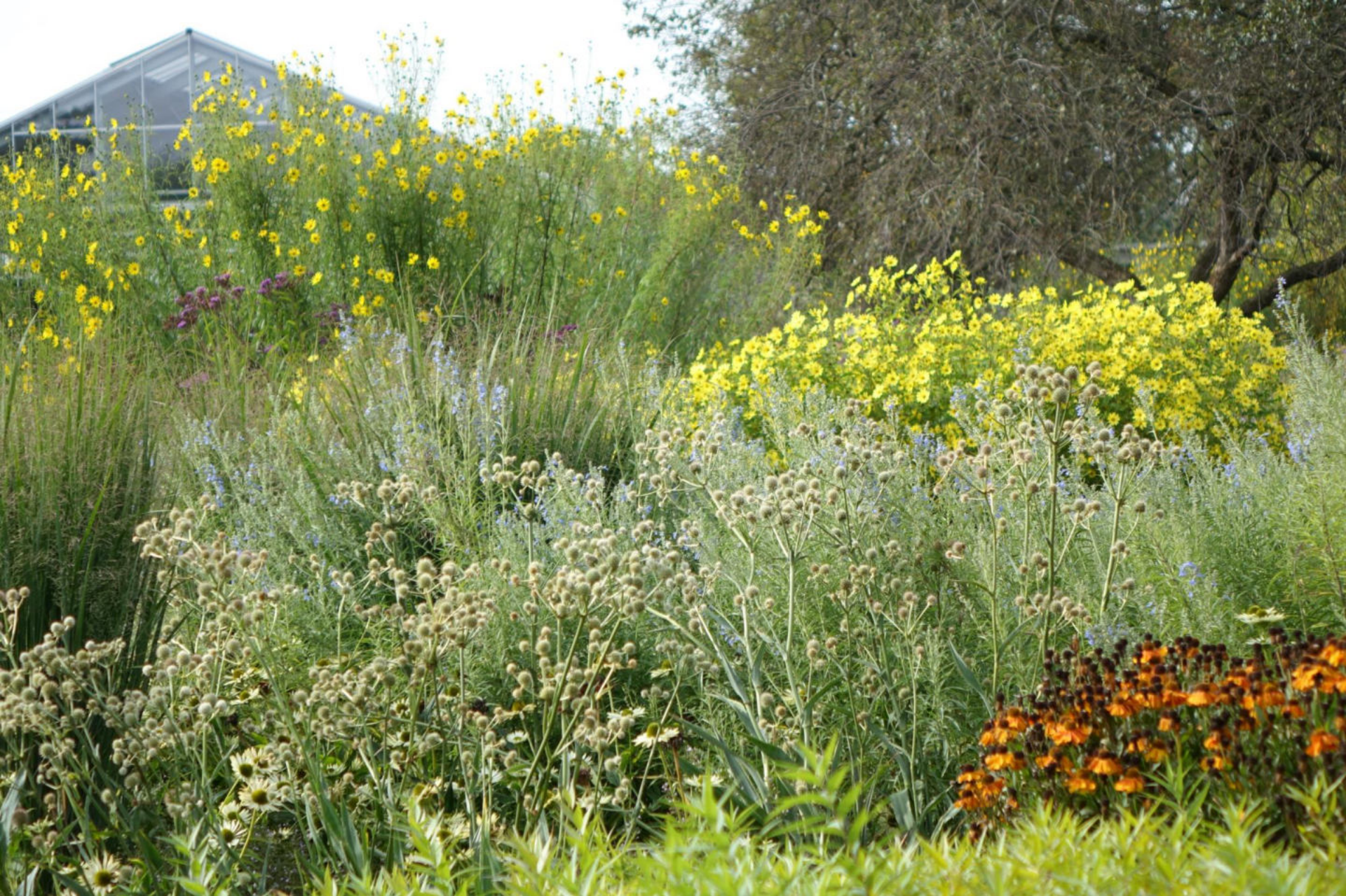
September [8] Eryngium yuccifolium , Salvia uliginosa , Helianthus 'Lemon Queen', H. orgyalis