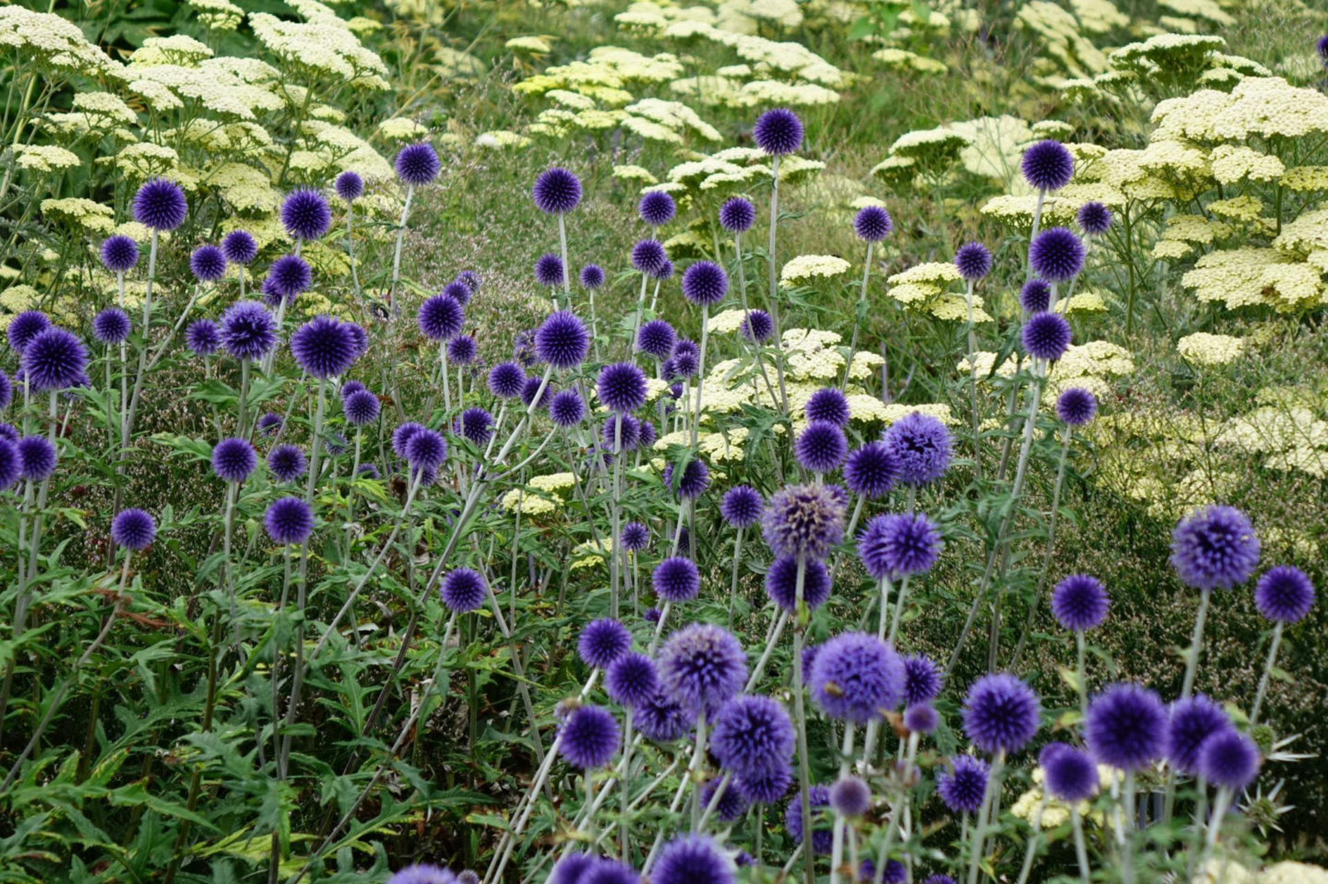
Juli [18] Echinops + Achillea