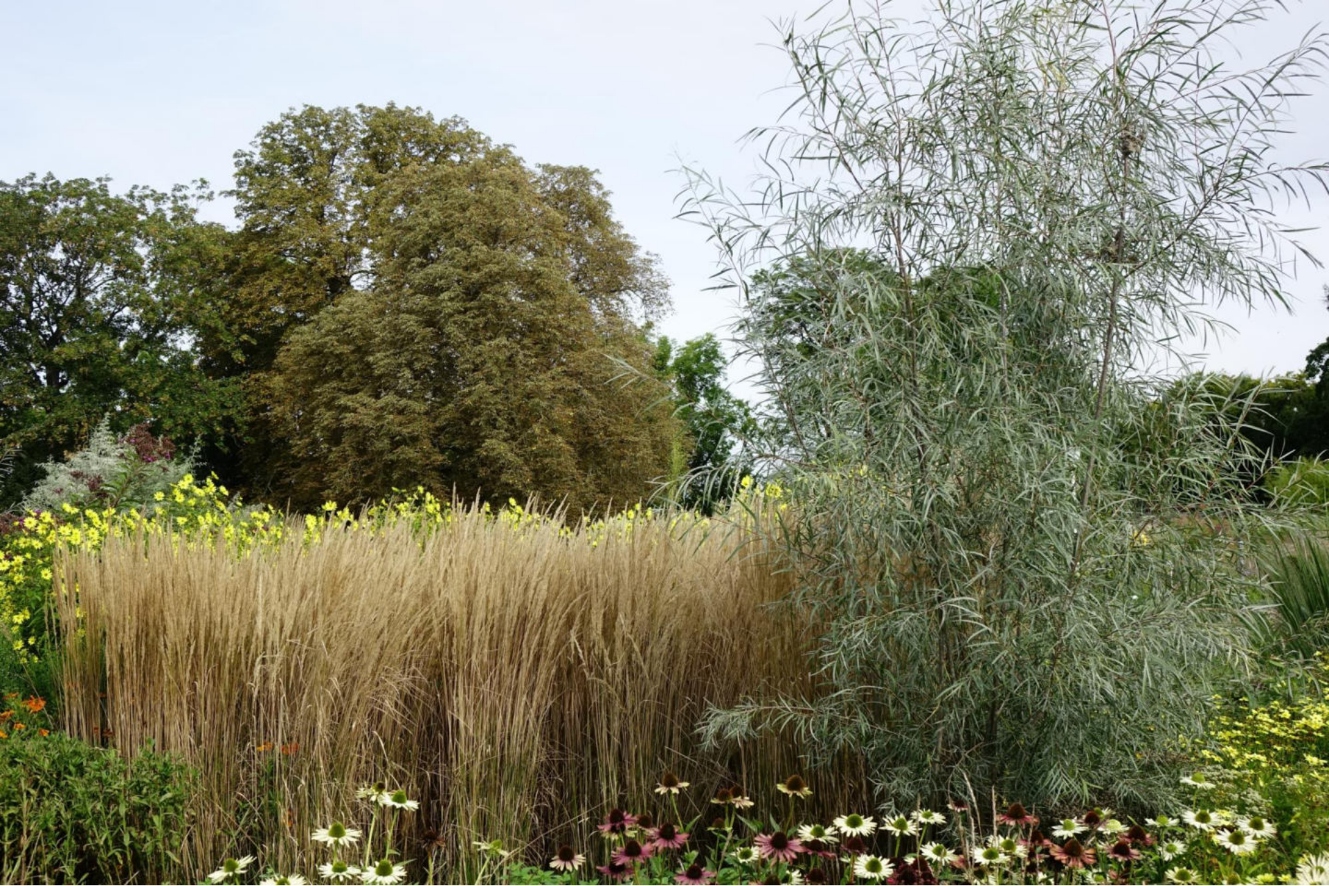
September [12] Salix exigua , Calamagrostis 'Karl Foerster'