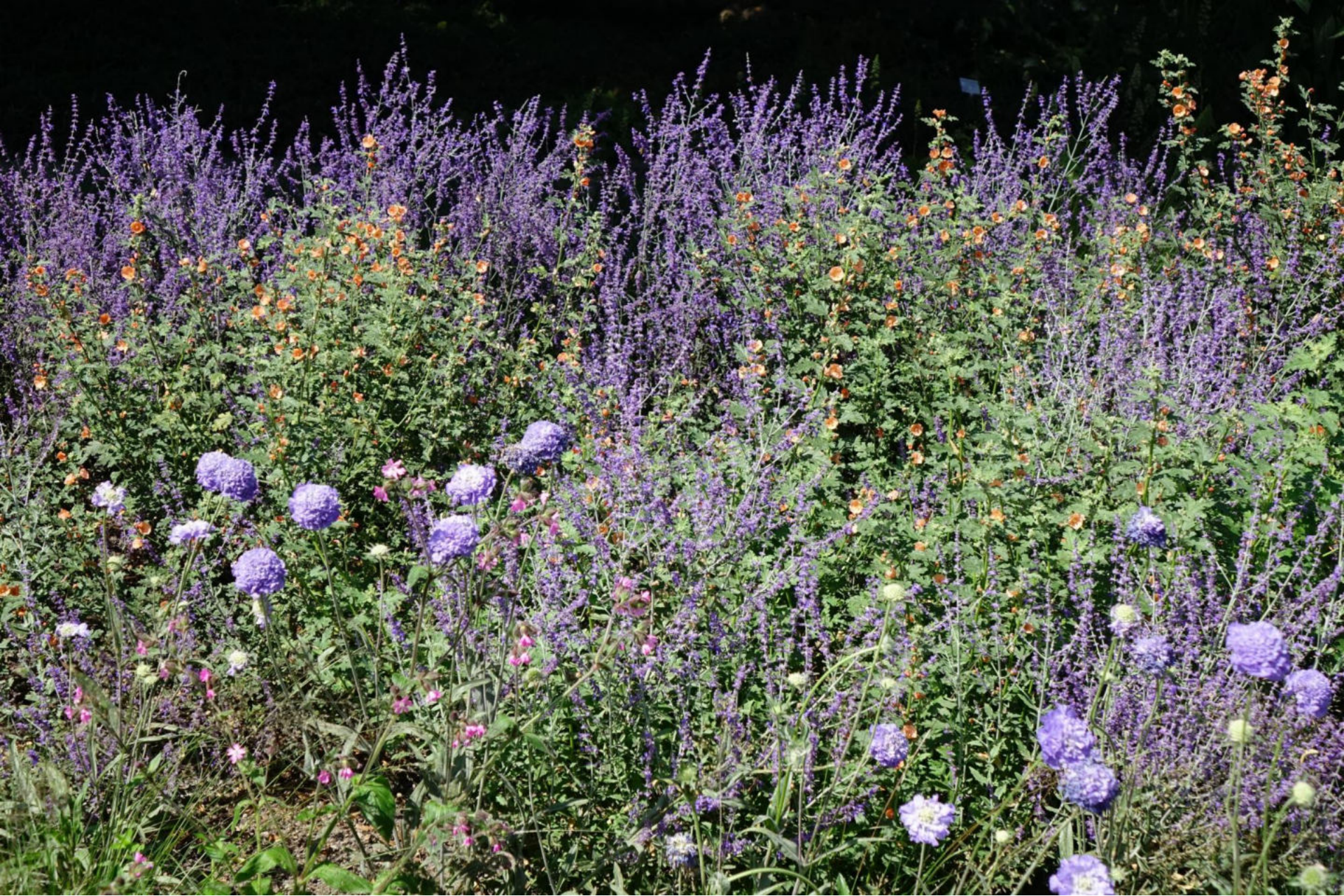
August [1] Perovskia + Scabiosa 'Butterfly Blue' + Sphaeralcea