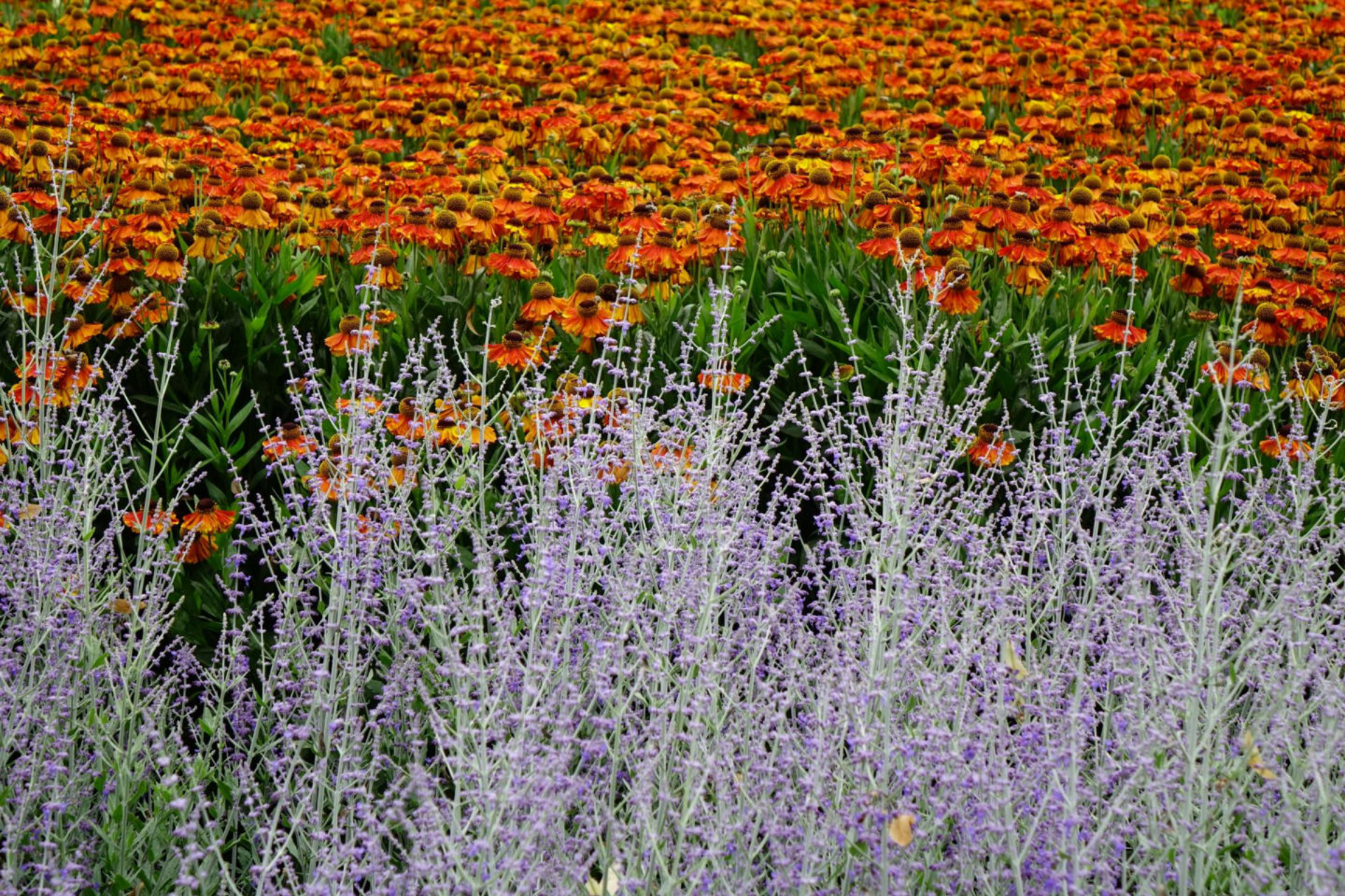
Juli [8] Helenium + Perovskia