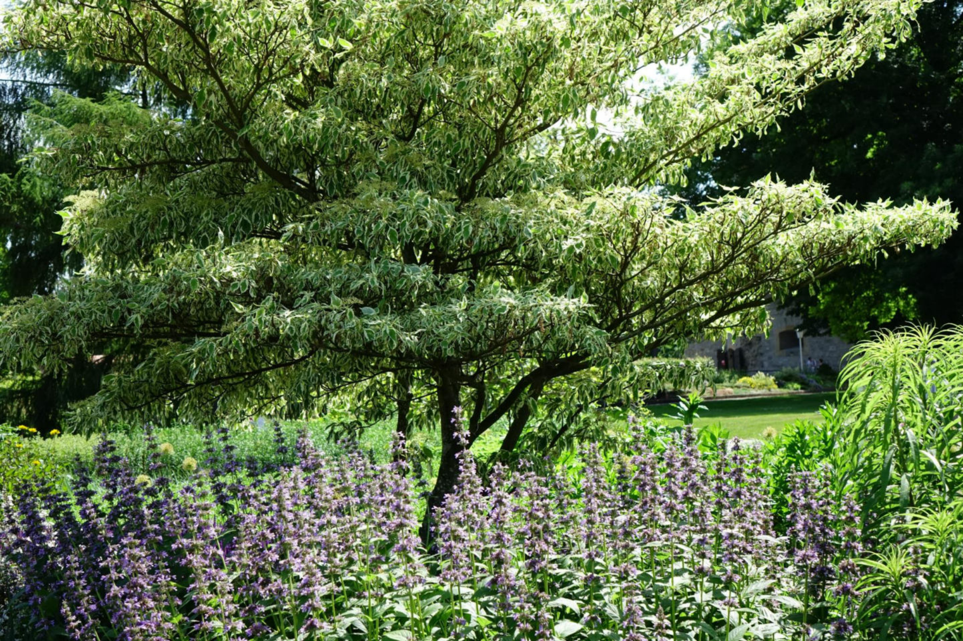
Juni [11] Cornus controversa 'Variegata' + Agastache