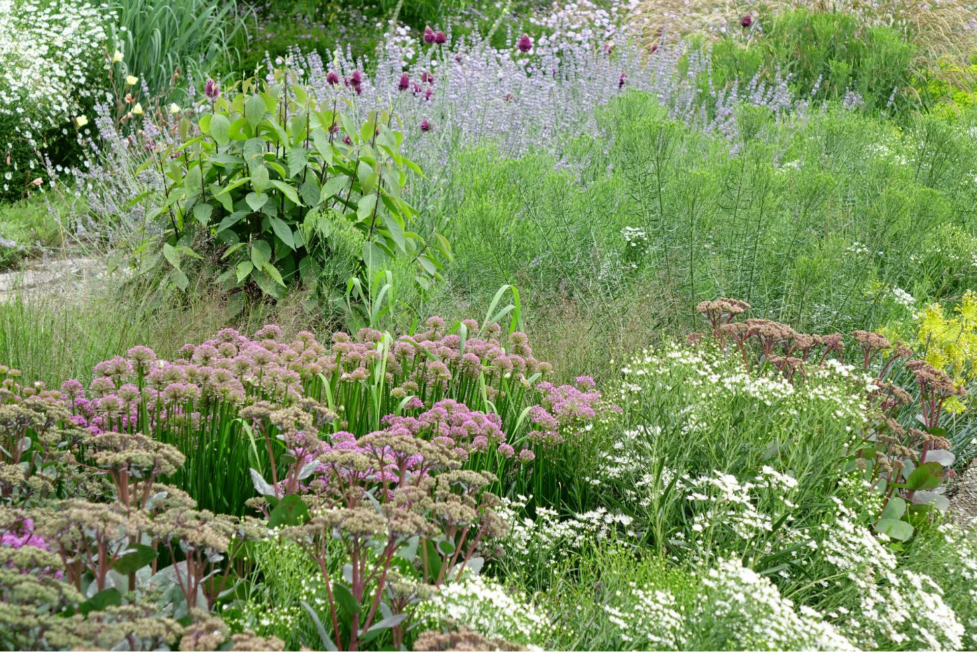
Juli [9] Allium 'Millenium' + Sedum 'Matrona'