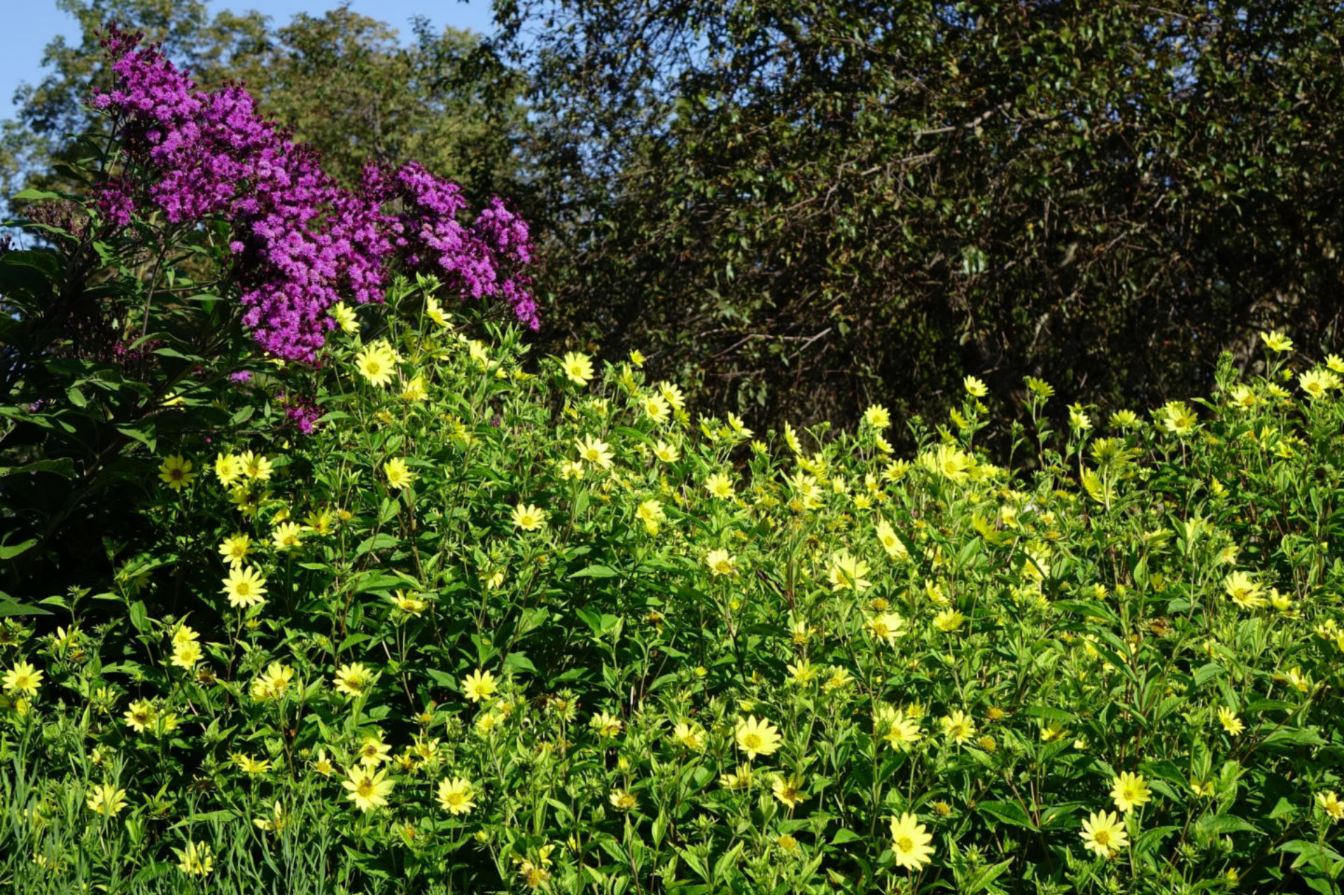
September [3] Helianthus 'Lemon Queen' + Vernonia