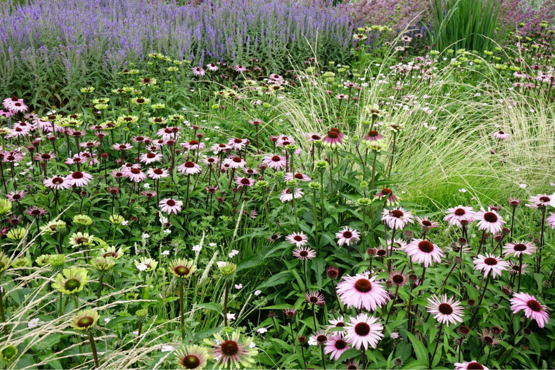
Juli [10] Echinacea purpurea + Festuca maieri