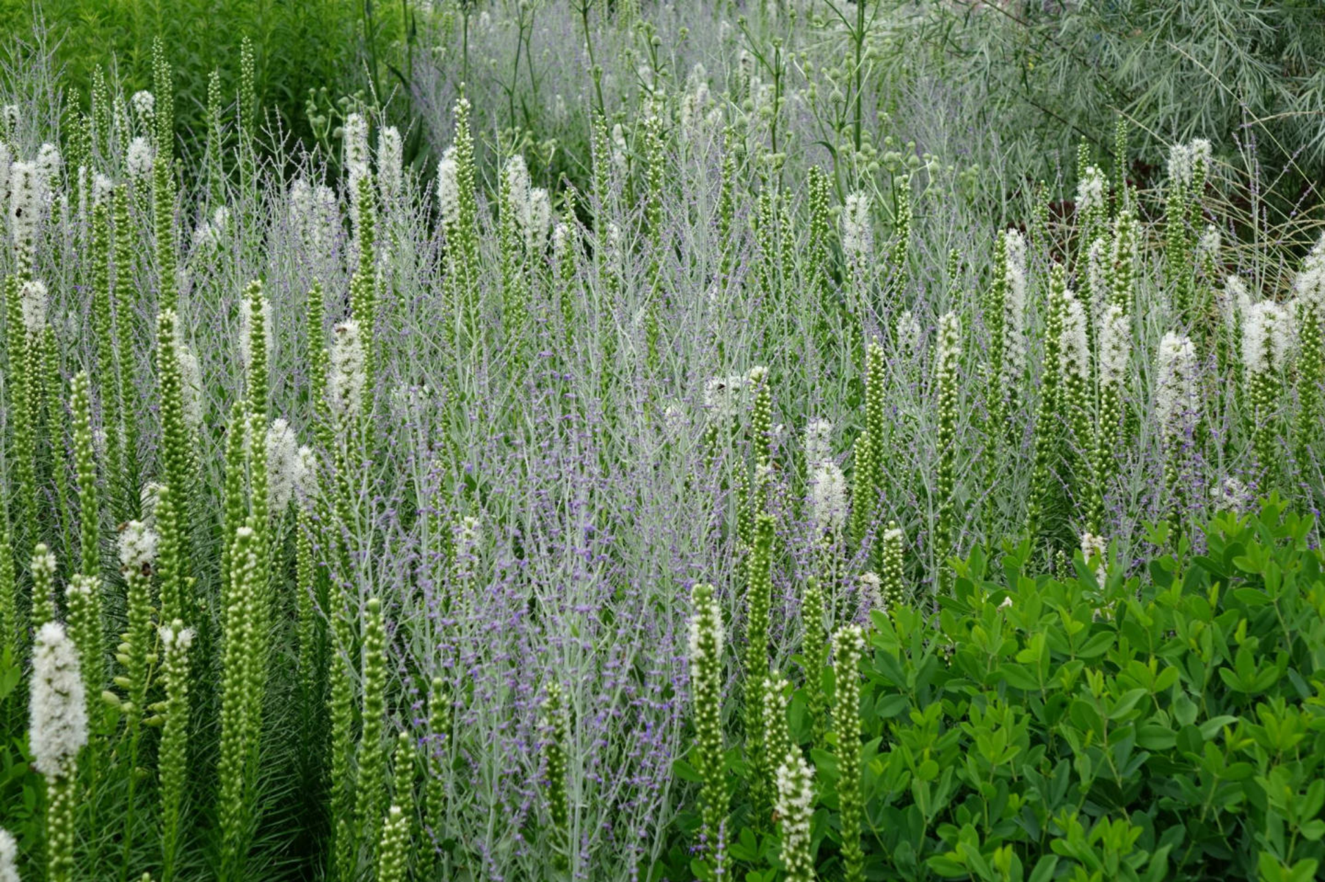
Juli [13] Liatris + Perovskia