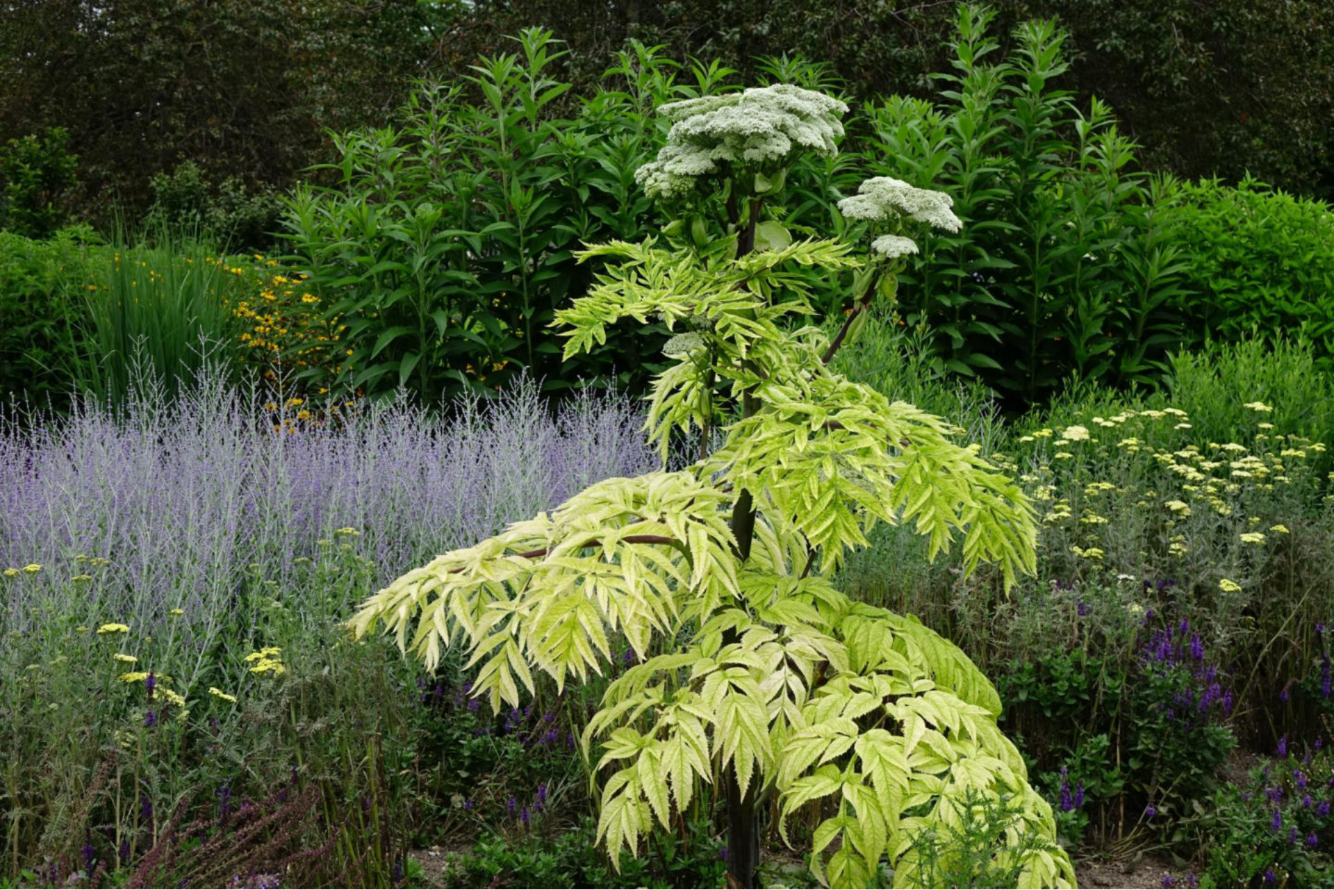
Juli [6] Angelica archangelica , Perovskia