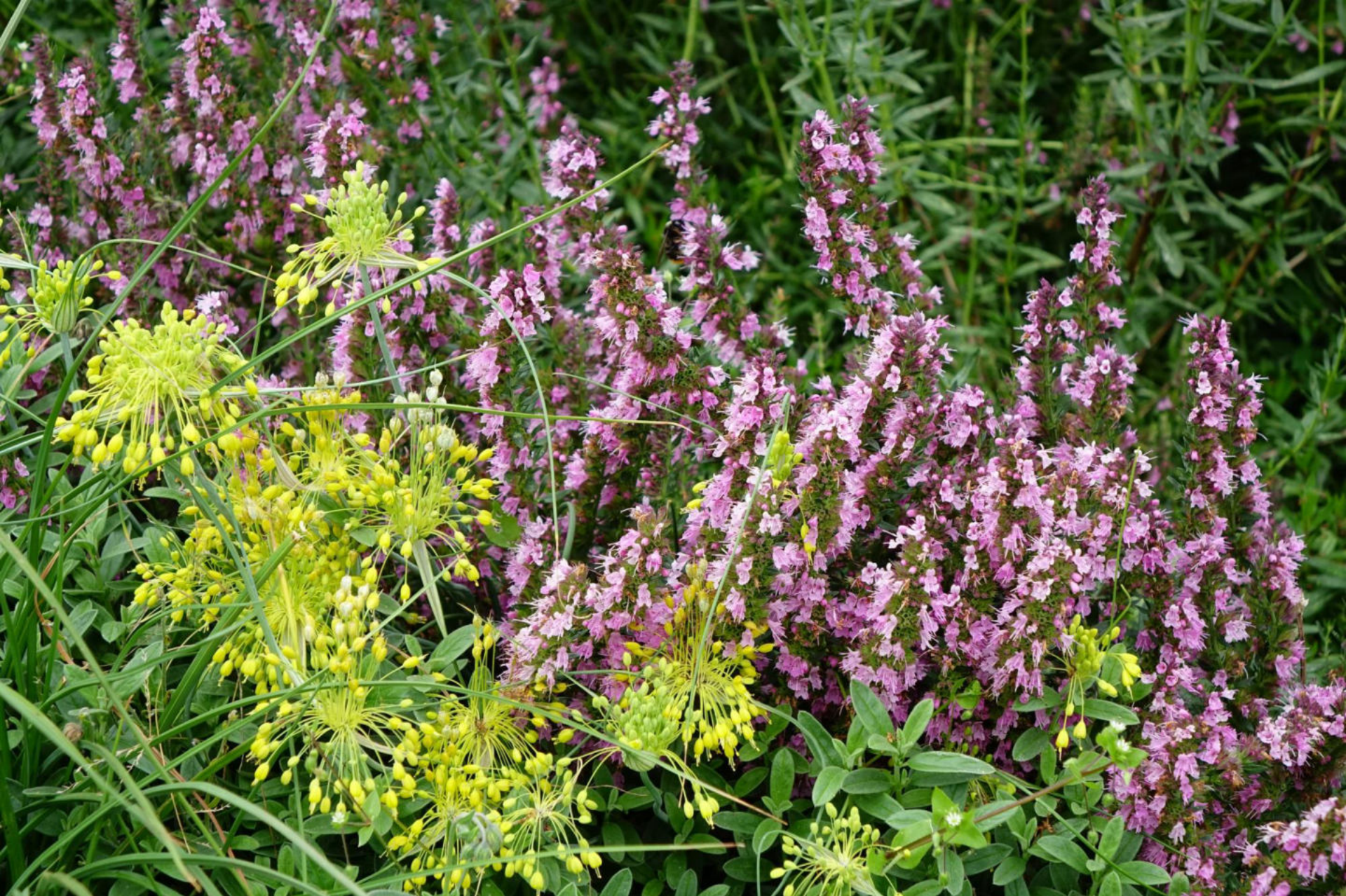
Juli [7] Allium flavum + Teucrium