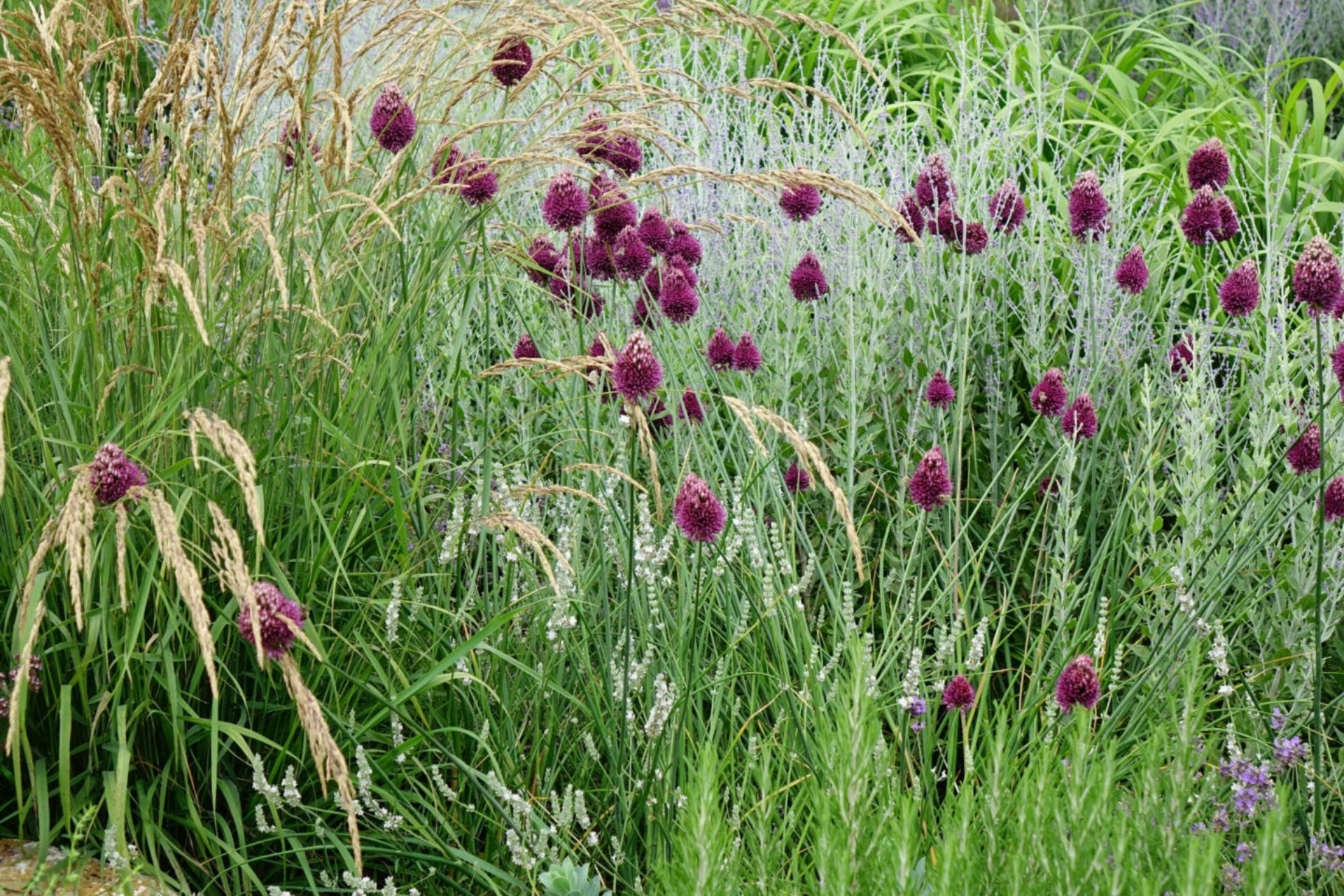
Juli [9] Stipa calamagrostis + Allium sphaerocephalon + Perovskia + Lavendel