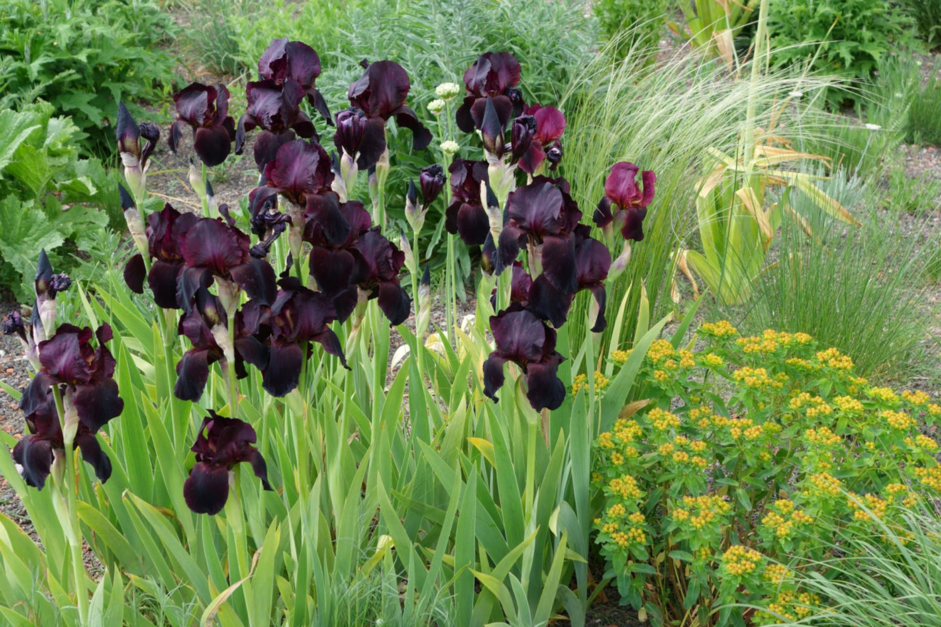
Juni [3] Iris germanica 'Superstition'