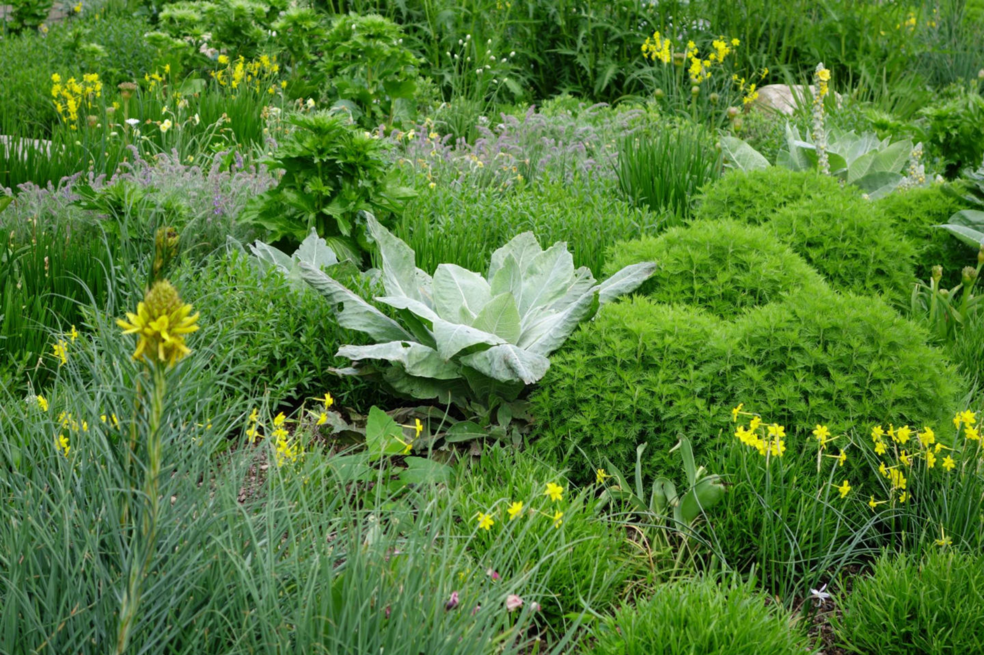
Mai [1] Asphodeline, Königskerze