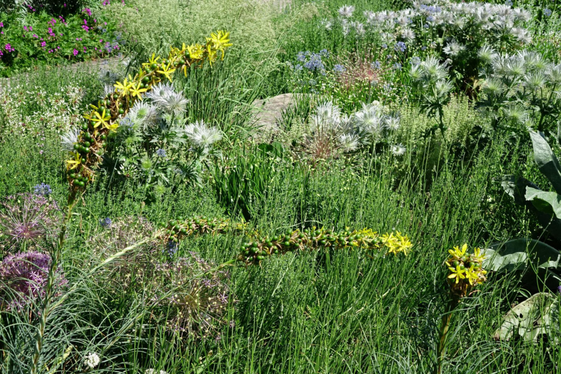
Juni [10] Asphodeline + Eryngium alpinum