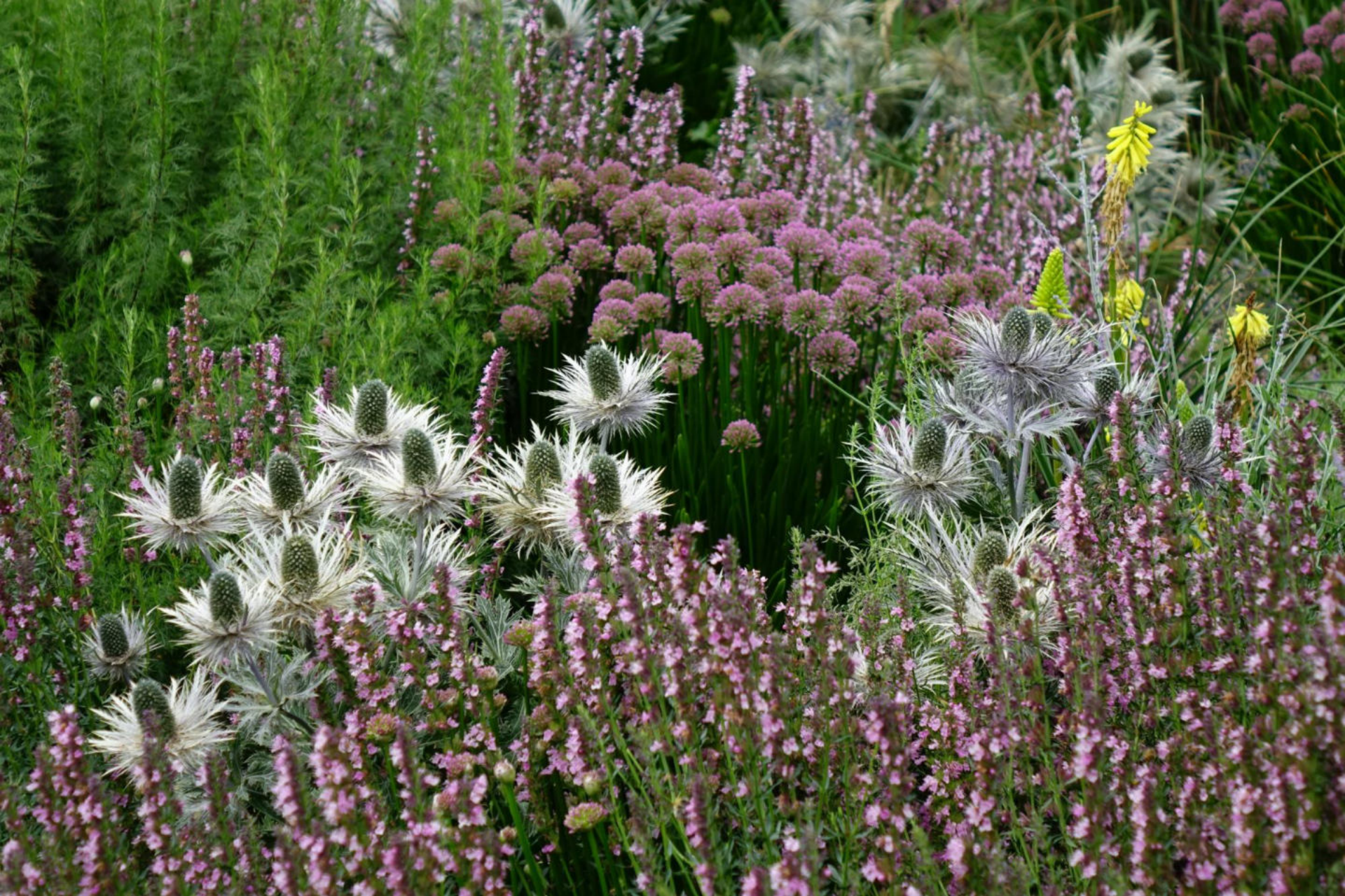
Juli [4] Eryngium alpinum + Allium 'Millenium' + Teucrium