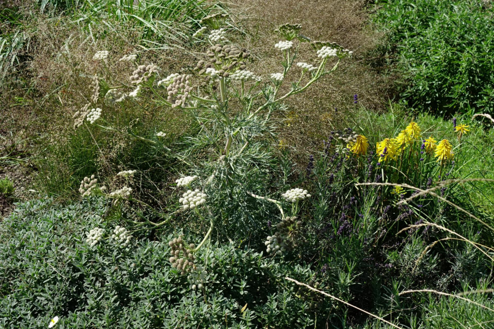
August [2] Seseli gummifera