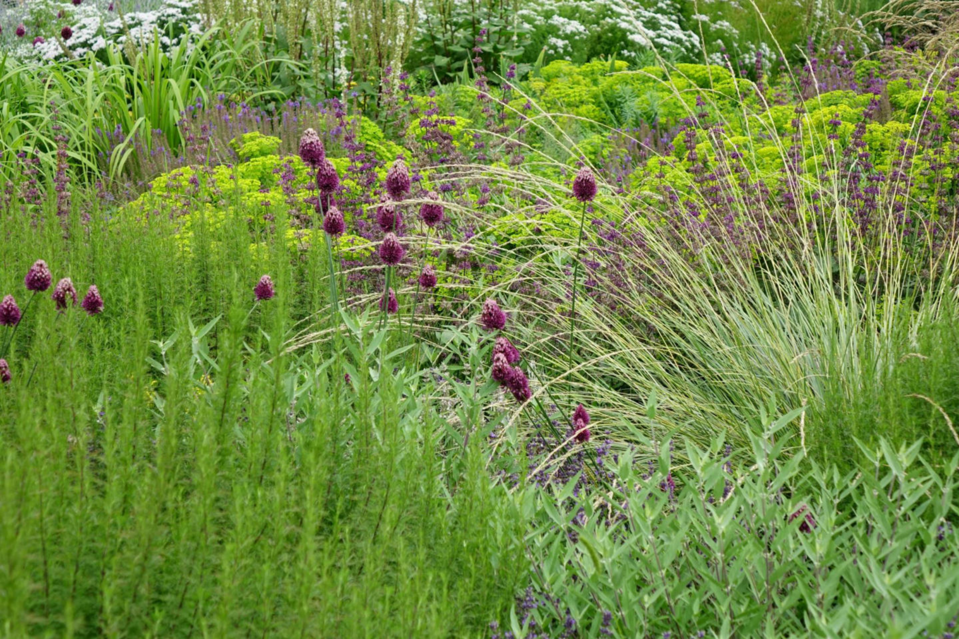
Juli [3] Allium sphaerocephalon + Festuca maieri