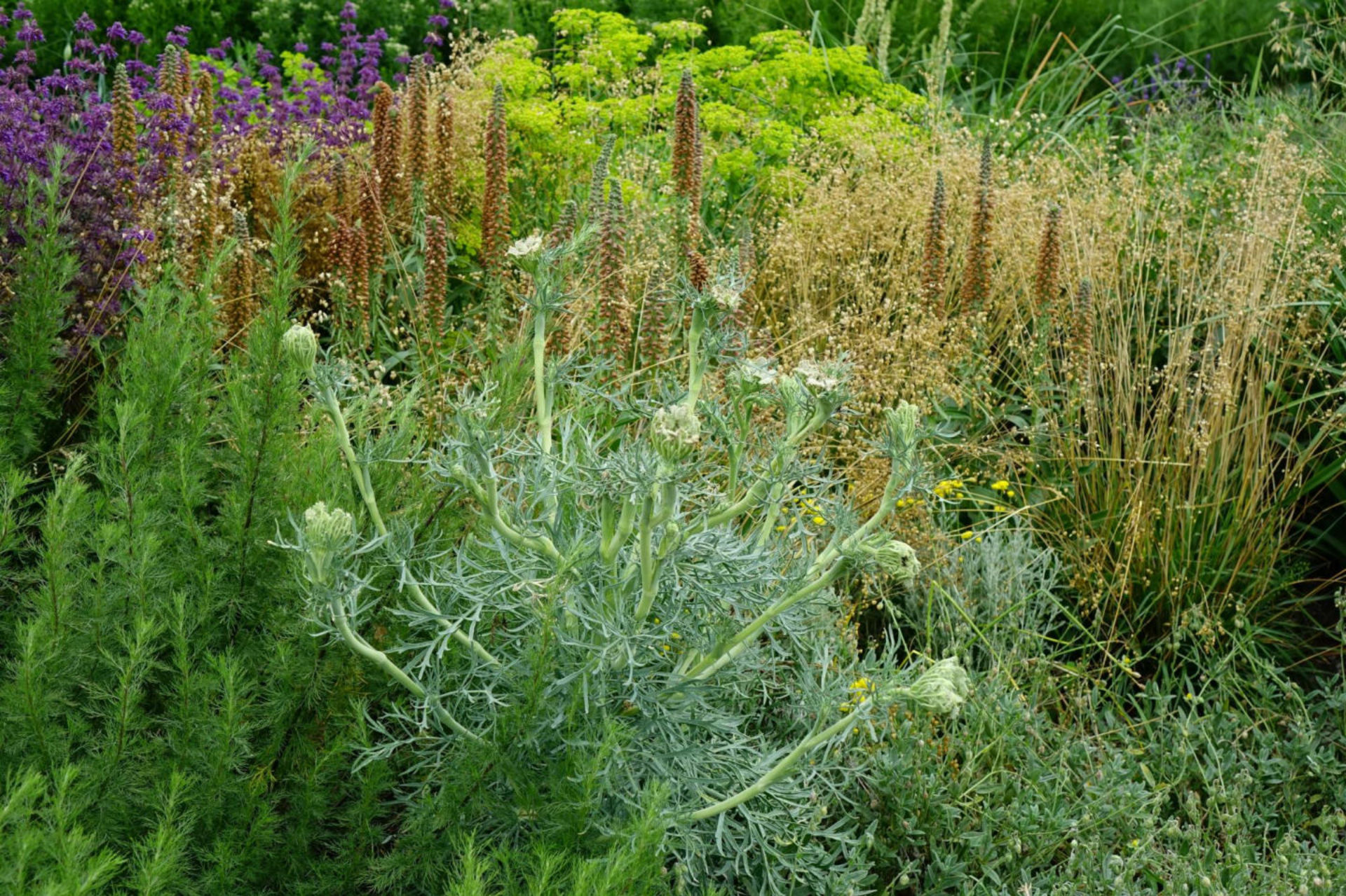
Juli [11] Seseli gummiferum