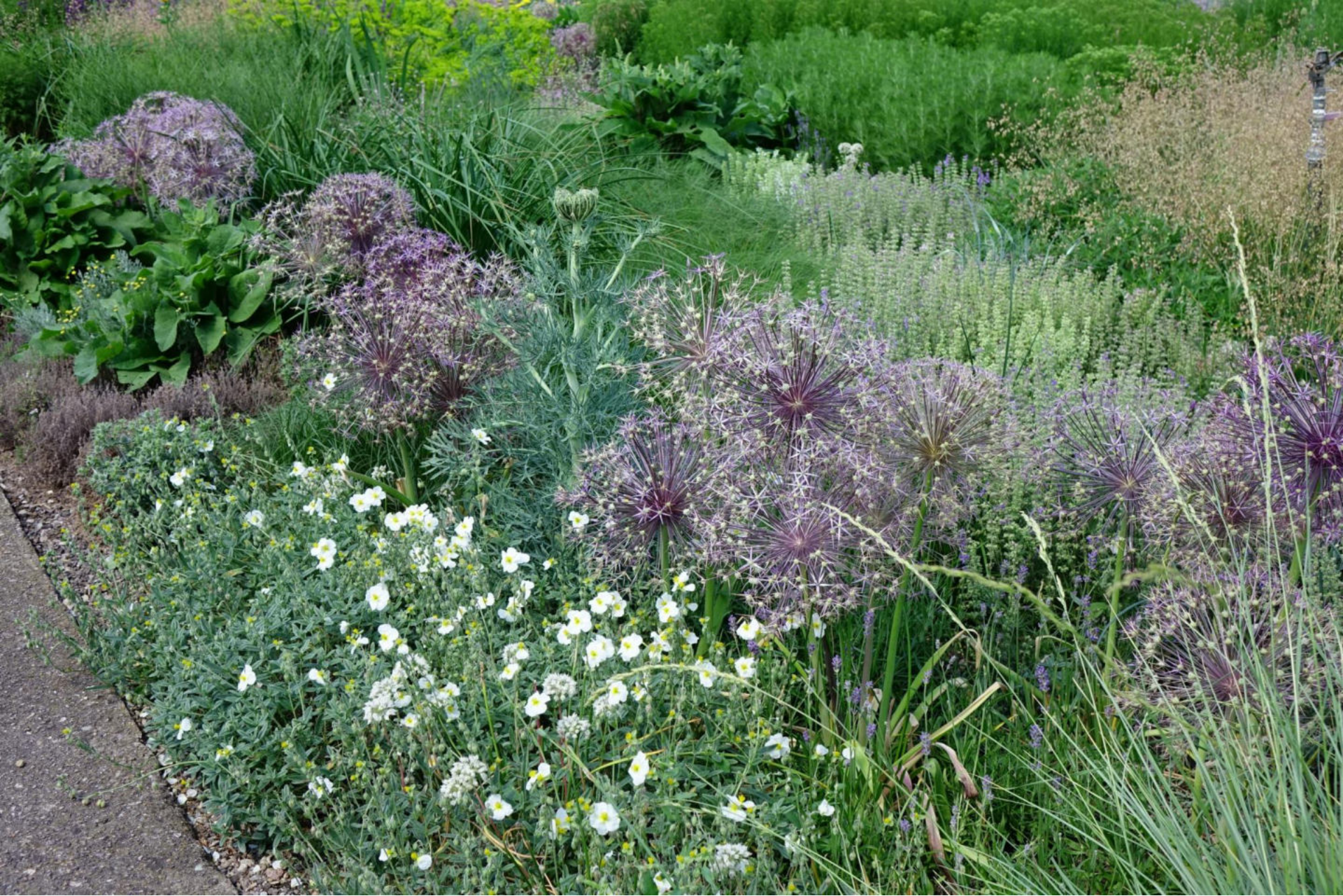
Juni [5] Allium christophii + Helianthemum + Seseli gummifera