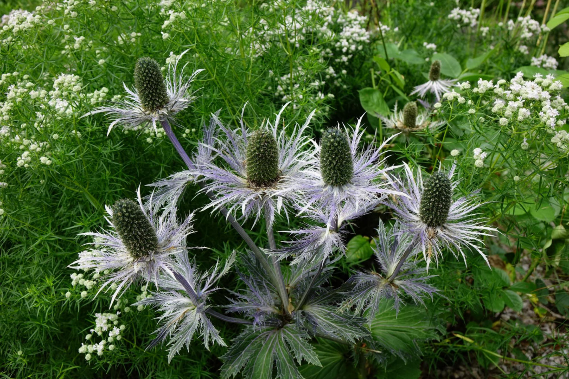
Juli [2] Eryngium 'Blauer Ritter'