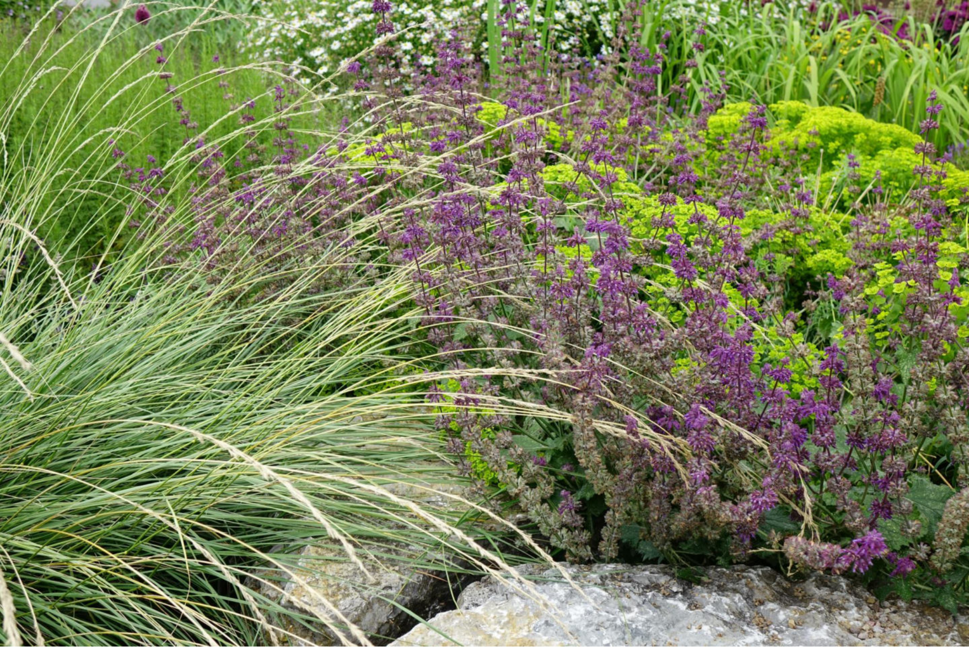
Juli [8] Festuca mairei