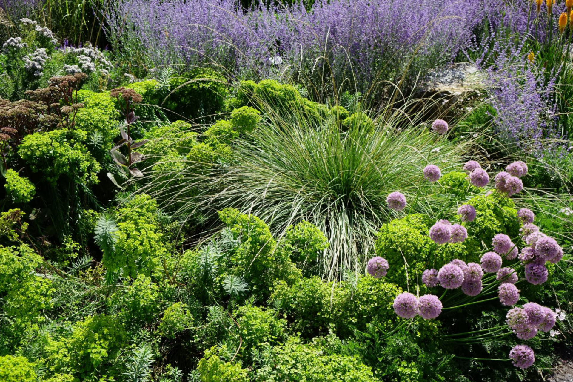
August [3] Euphorbia seguieriana + Allium 'Millenium' + Festuca mairei + Perovskia