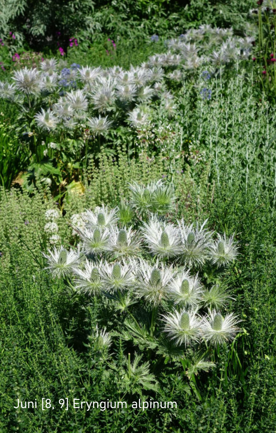
Juni [8, 9] Eryngium alpinum