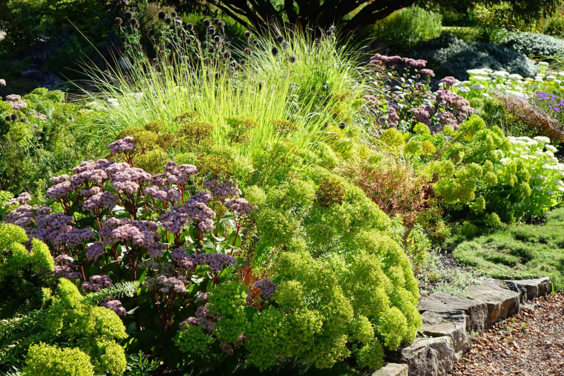
September [2] Euphorbia seguieriana + Sedum 'Matrona'