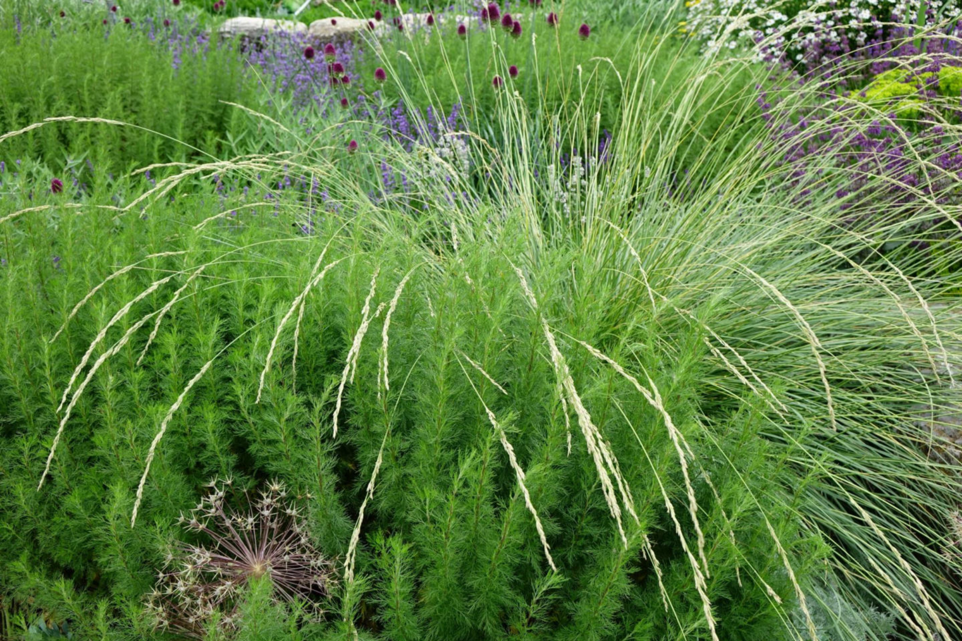
Juli [12] Festuca mairei