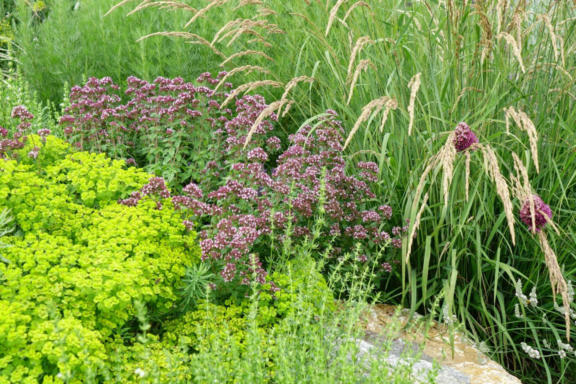
Juli [10] Euphorbia seguieriana + Origanum + Stipa calamagrostis