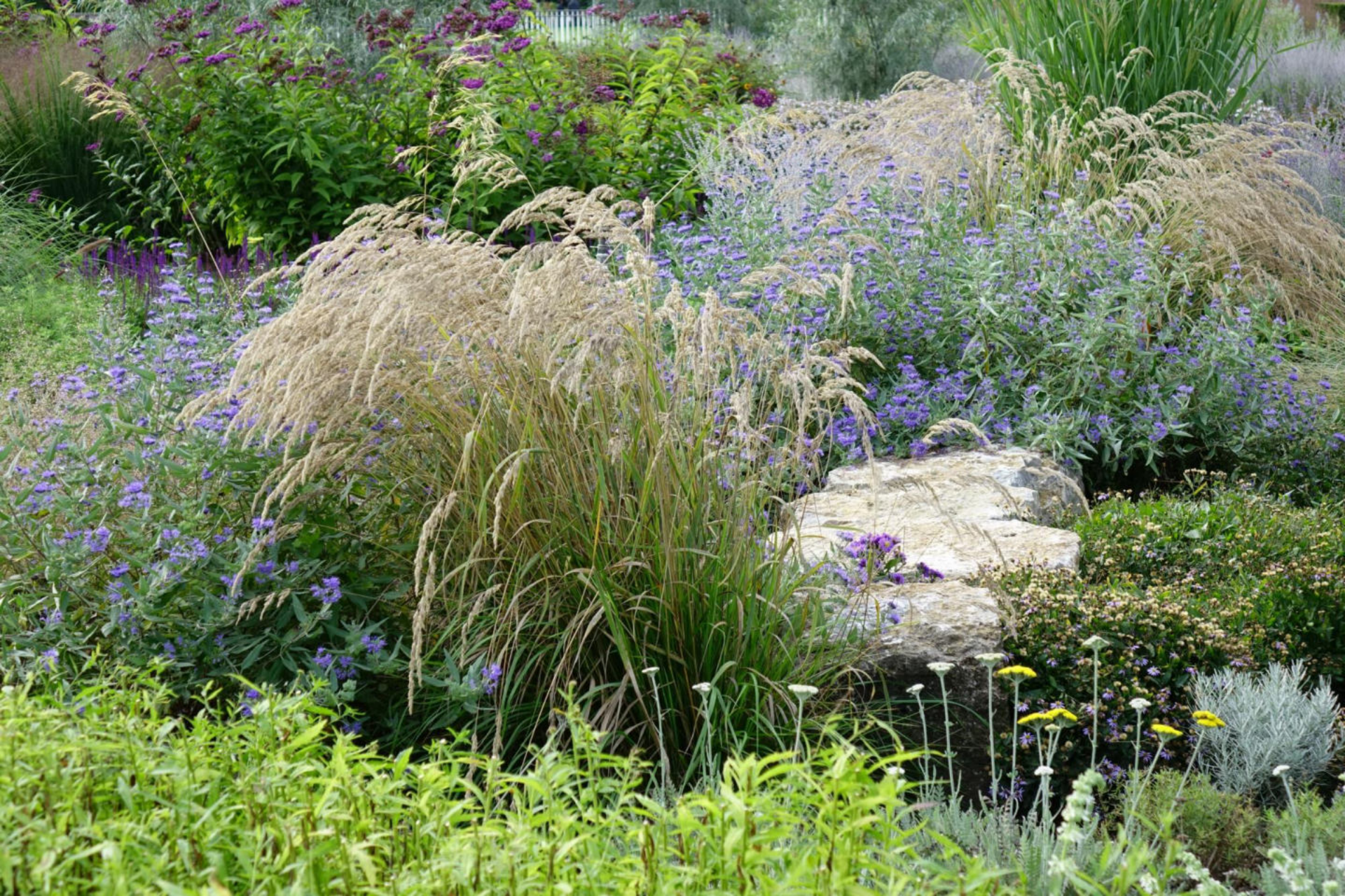
September [2] Stipa calamagrostis + Caryopteris