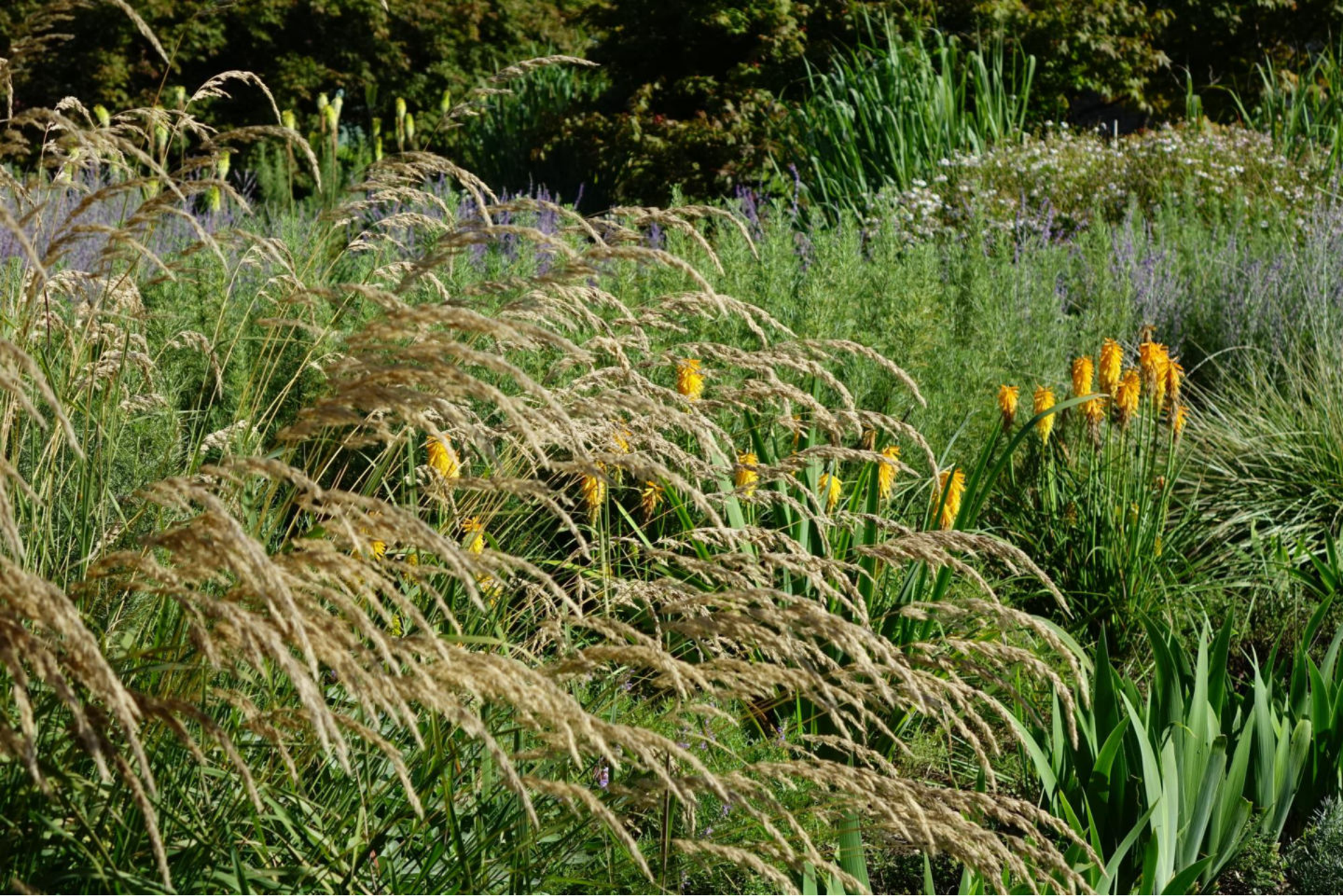
September [3] Stipa calamagrostis + Kniphofia