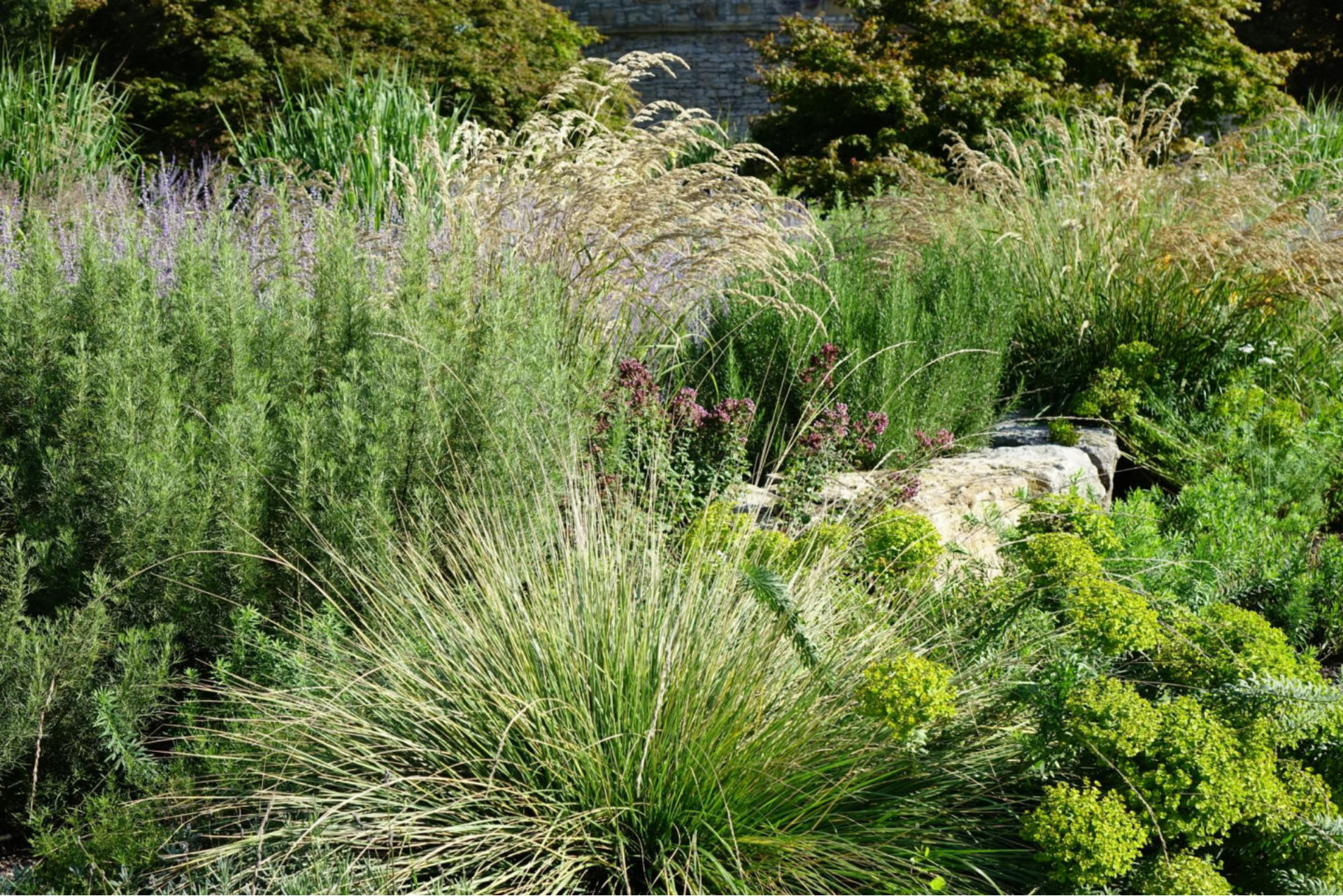
September [4] Festuca maieri , Stipa calamagrostis