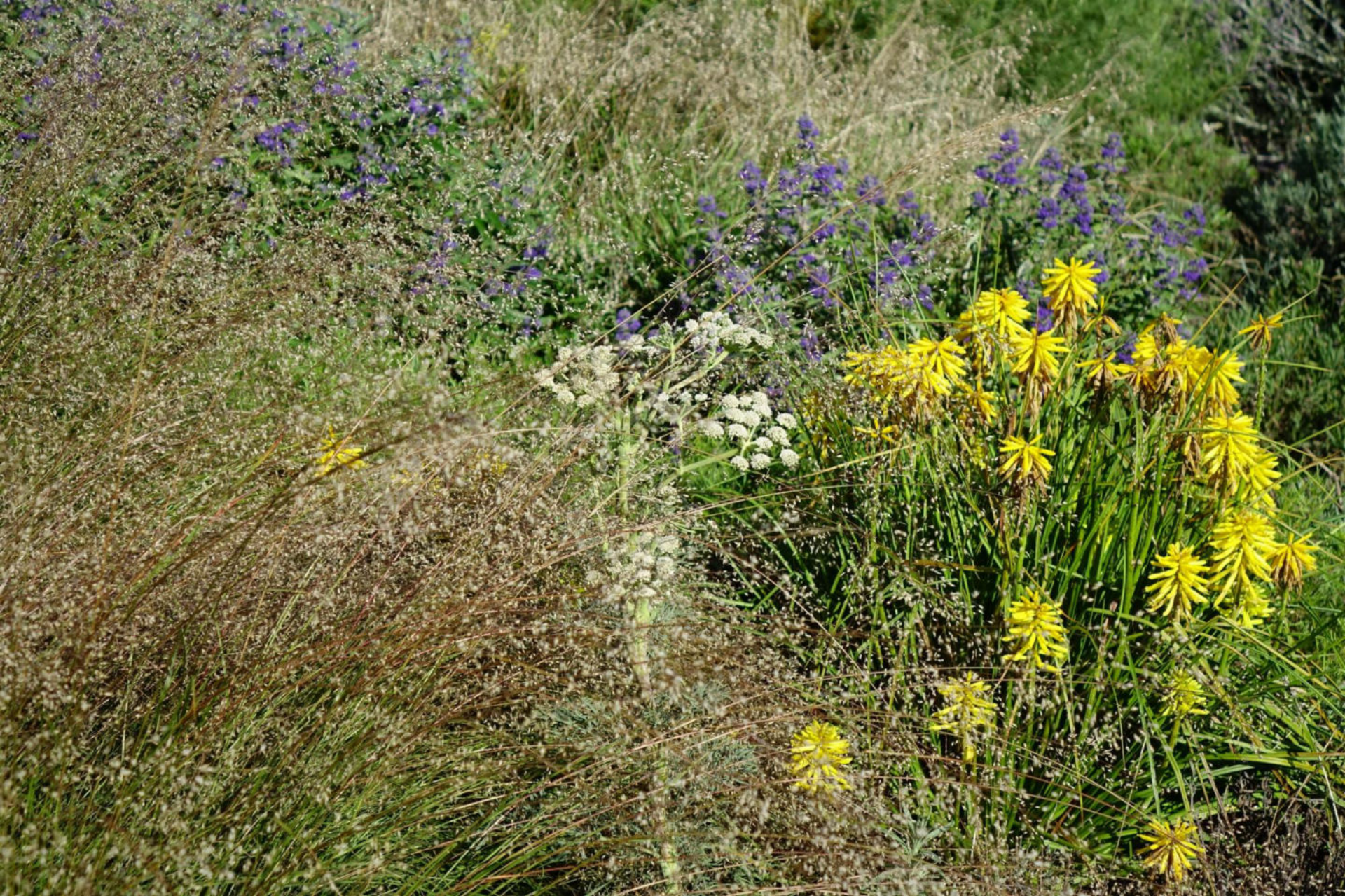
September [3] Sporobulus, Kniphofia, Seseli gummiferum