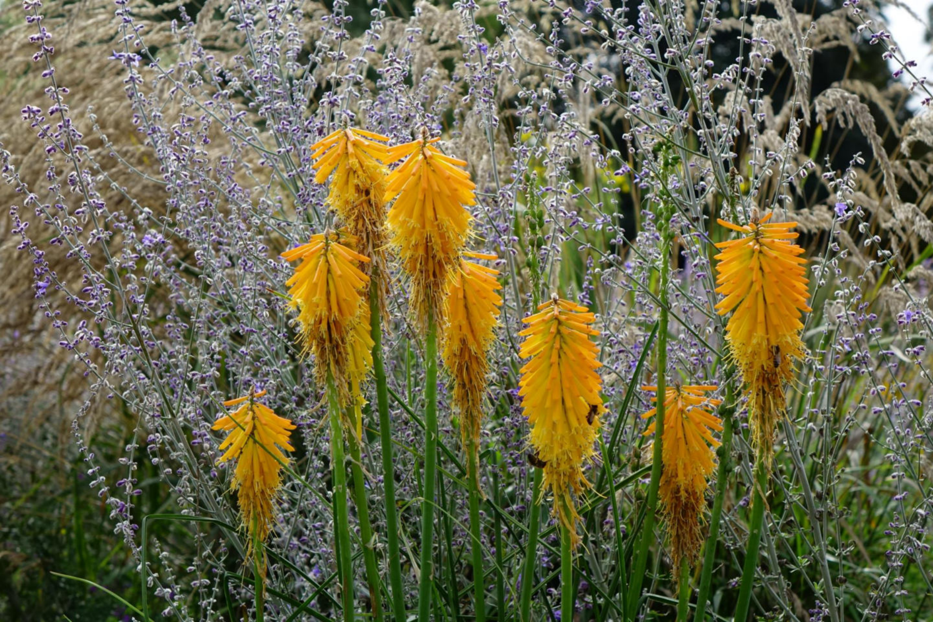
September [1] Kniphofia + Perovskia