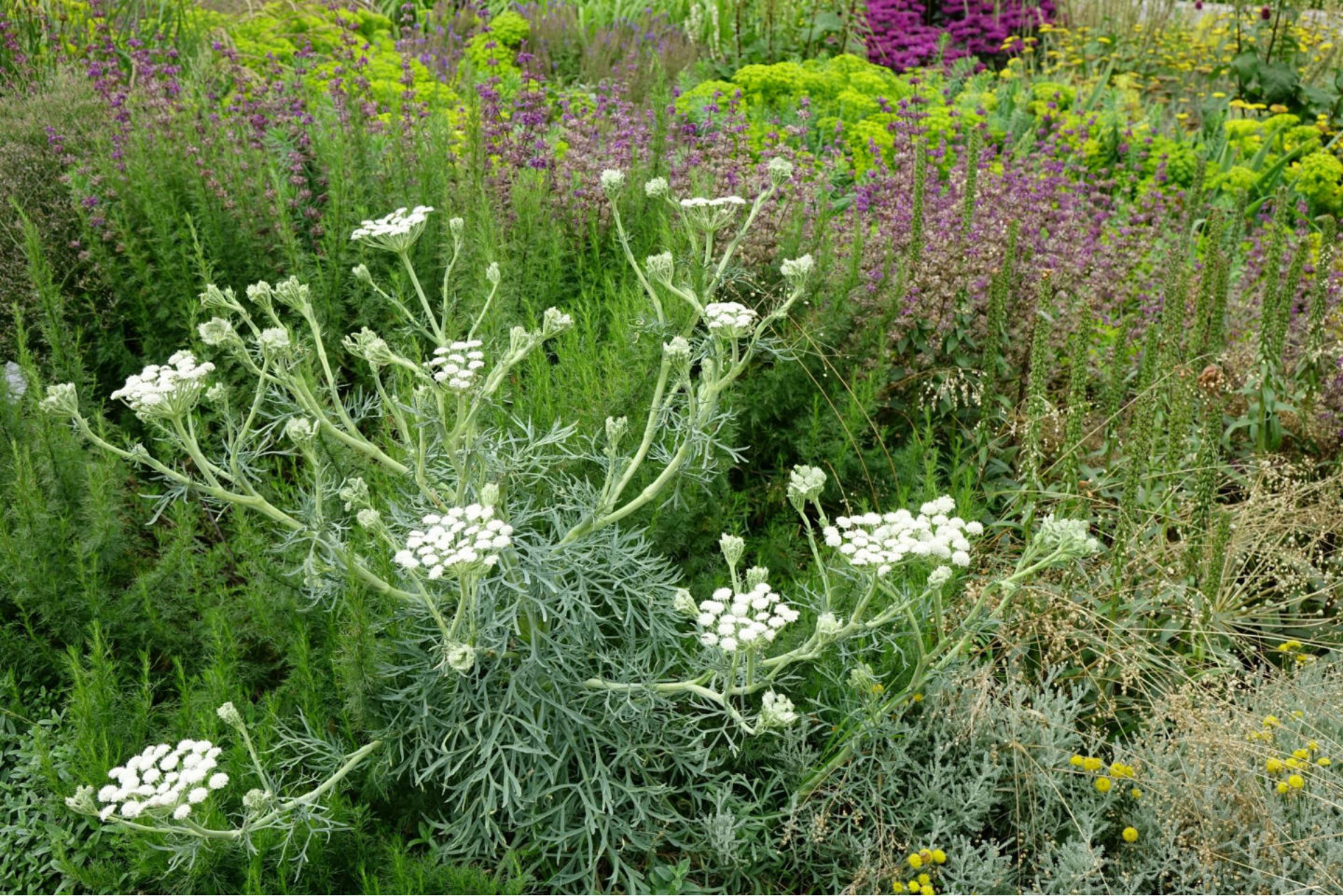
Juli [1] Seseli gummiferum